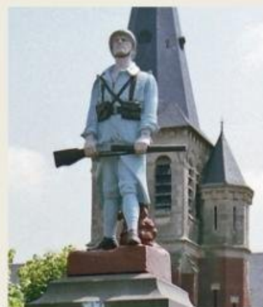
Résistance Réf: 854 Val d'Osne