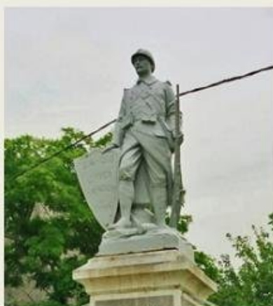
Poilu à l'écu Fonderie de Tusey