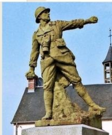
Grenadier Réf: 857 Val d'Osne