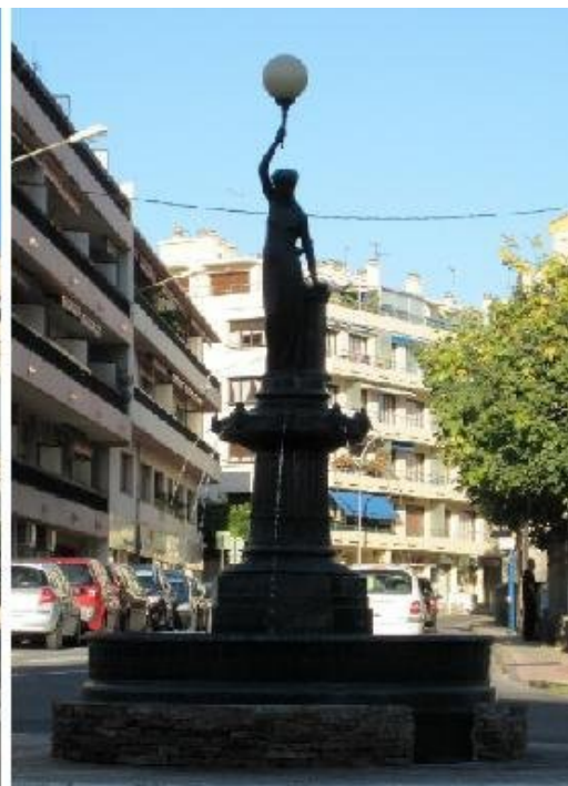
La fontaine Godillot et la fontaine "la femme au flambeau" coulées aux fonderies du Val d'Osne