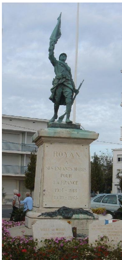
Monument aux morts de Royan