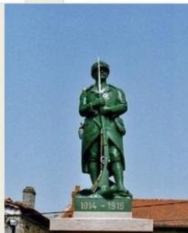
Poilu baïonnette au canon Réf: 853 Val d'Osne

Statue intitulée " La victoire en chantant " du village de Craponne-sur-Arzon Le sculpteur est Richefeu Charles né en 1868 mort en 1945, Ref. 861 du catalogue du Val d'Osne A quelques dizaines d'exemplaires répartis sur le territoire national