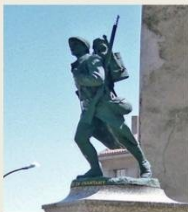
La victoire en chantant Réf: 861 Val d'Osne

D'autres statues de poilu en fonte de fer surmontent les monuments aux morts