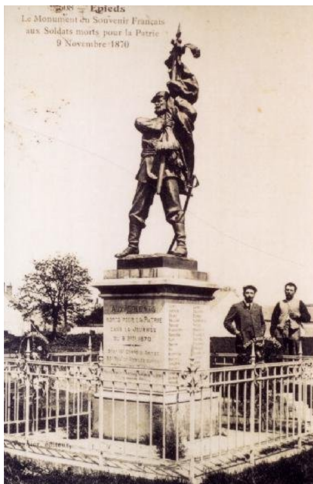
Un monument aux morts plus ancien (guerre de 1870) à Epieds

On dit que cela a été le chant du cygne pour la fonte d'art, trop occupé à " faire du poilu " pour s'intéresser à d'autres marchés. Le monde né des tranchées n'a plus grand chose à voir avec " la belle époque ". Le monument aux morts enterre en même temps que le sacrifice des Français, une époque et un art de vivre.