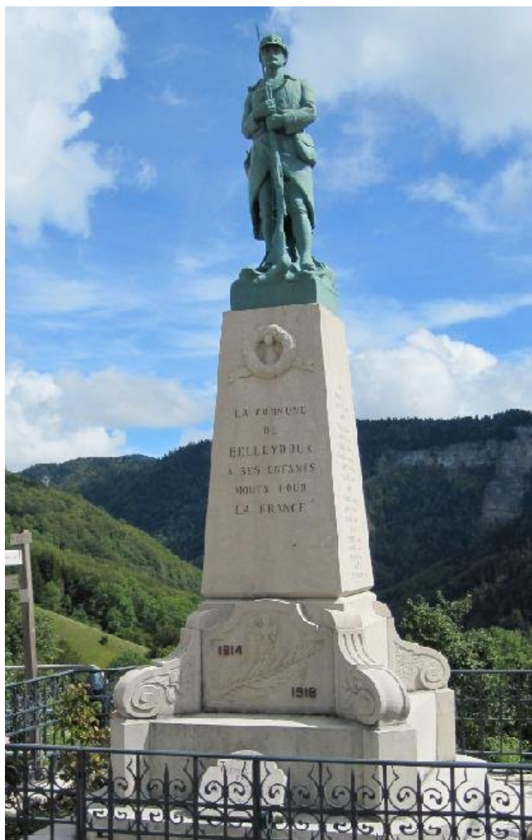
Statue " Le poilu baïonnette au canon " érigée dans la commune de Belleldoux dans l'Ain.

A droite, la page de garde du catalogue des fonderies