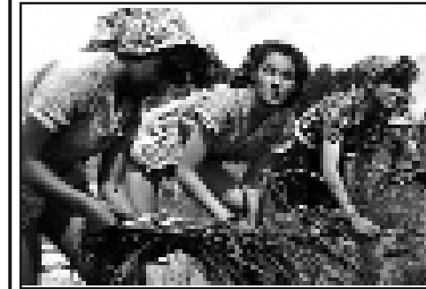
Un suspense habile, doublé d'un mélo poignant. (Zurban)

Après avoir volé un collier, un jeune voyou, Walter, et sa complice, Francesca, se mêlent à un convoi de travailleuses qui part vers les rizières.