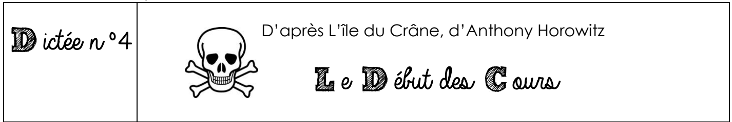
Tableau des mots :