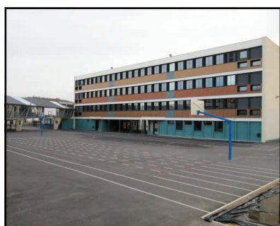
Southern face / face sud

A modern school / Un établissement moderne