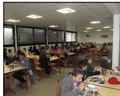
Canteen / la cantine