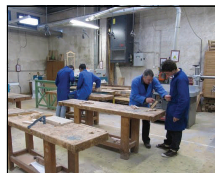
Workshops / les ateliers