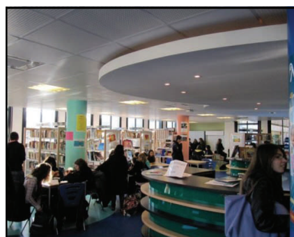
Library / le CDI