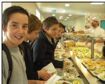
Cafeteria / la cafétéria

A three-star restaurant / Un restaurant 3 étoiles