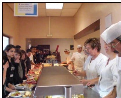
Pupils, teachers, staff