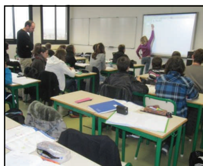
Numerical board / le tableau numérique