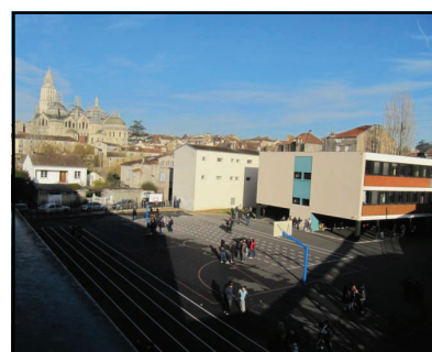
Northern face / face nord

A three-star restaurant / Un restaurant 3 étoiles