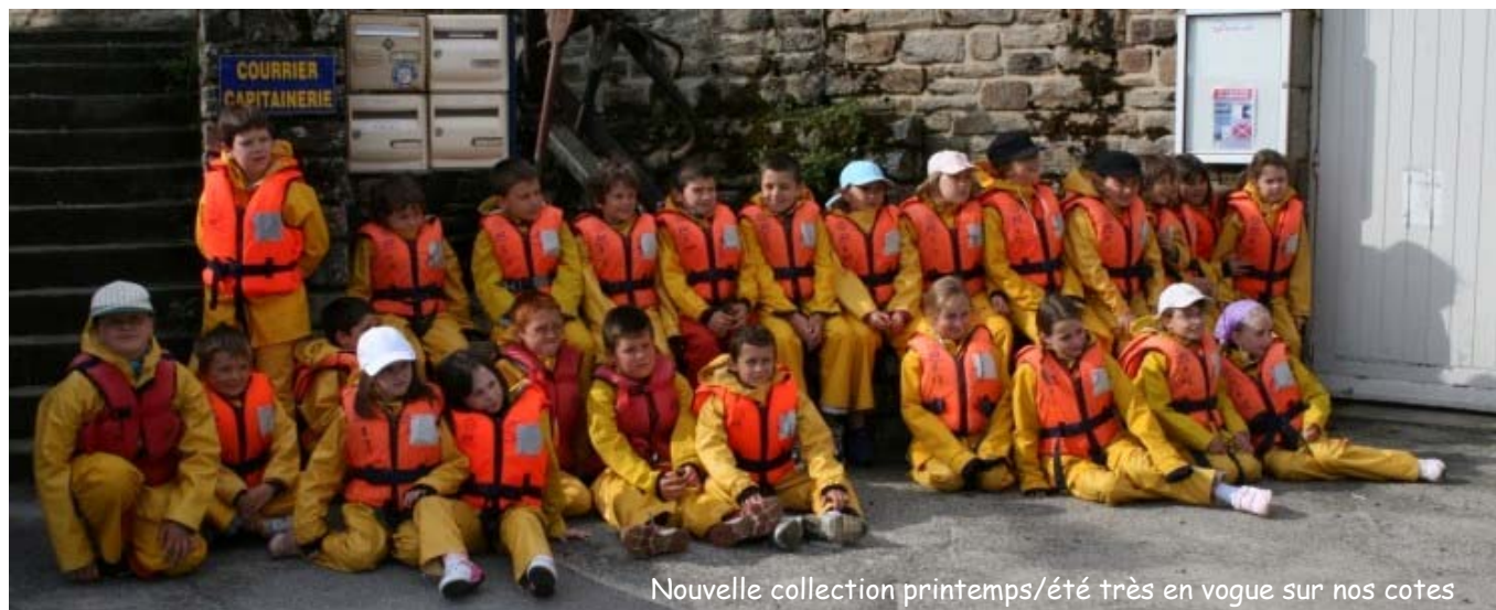
Nouvelle collection printemps/été très en vogue sur nos cotes