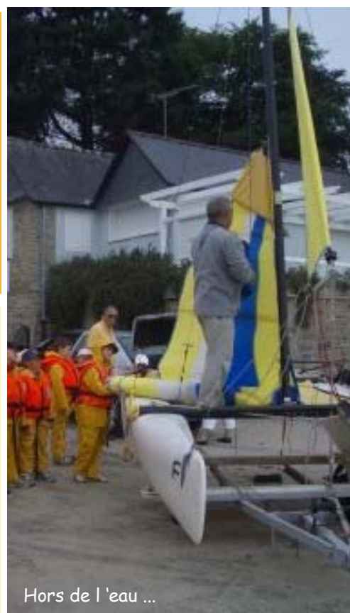
Hors de l'eau ...