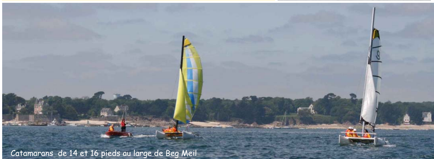
Catamarans de 14 et 16 pieds au large de Beg Meil