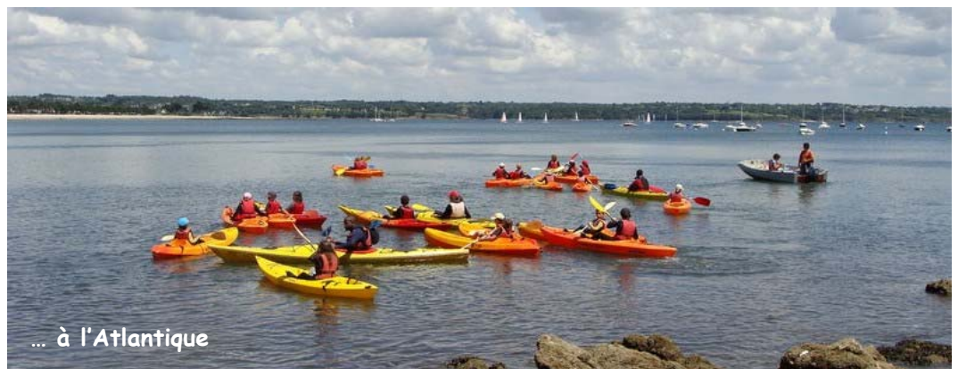
... à l'Atlantique

Par de nombreux jeux, les enfants ont rapidement acquis l'art et la manière de se déplacer avec les piccolos, les vénus ou les discos.