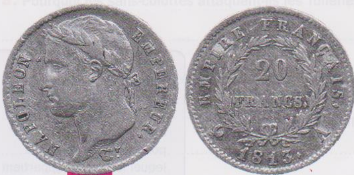
Doc. 2 Napoléon crée une nouvelle monnaie : le franc.

3. À ton avis, que recherche Napoléon en s'inspirant des rois de France ?