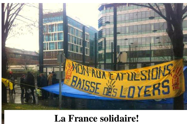
La France solidaire!