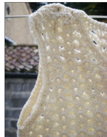
Finitions des manches

Vous avez réussi à suivre les explications! Bravo !