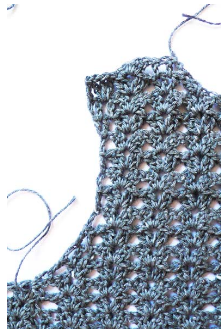
Le ½ pan « dos » et « épaule gauche »

25 ème rang, faire 4ml, 1b, 1ml, sauter 2b, faire sous la ml suivante 2b, 1ml, 2b, *sauter 4b, faire sous la ml suivante 2b, 1ml, 2b*, répéter 8 fois de *à*, 1ml, sauter 2b et faire 1b, 1ml, 1b dans la ml de la lisière, tourner.