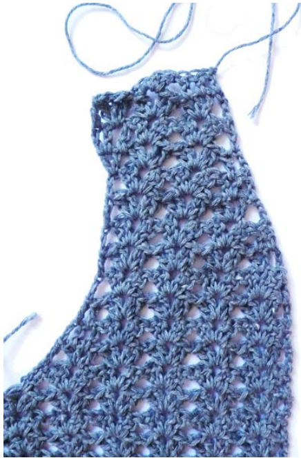
Le pan « avant droit »

17 ème rang, faire 3 ml, sauter 3b, faire sous la ml suivante 1b, 1ml, 1b, 1ml, 1b *sauter 4b, faites sous la ml suivante 2b, 1ml, 2b* , répéter 3 fois de * à * , sauter les 2 dernières b et faire 1b dans la ml de la lisière, tourner.