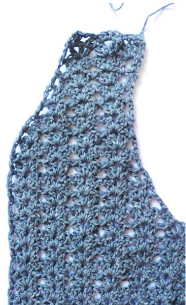
Le pan « avant gauche »

25 ème rang, faire 3ml, sauter 1b, faire sous la ml suivante 1b, sauter 3b, faire sous la ml suivante 2b, 1ml, 2b, sauter 4b, faire sous la ml suivante 2b, 1ml, 2b, sauter 2b et faire 1ml, 1b, 1ml, 1b dans la ml de la lisière, tourner.