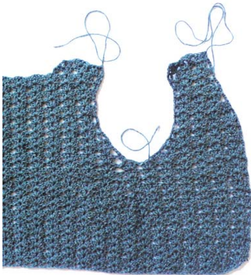
Diminutions latérales du « corps »

4 ém e rang, faire 3 ml, sauter les 2 premières b, faire sous la ml suivante, 2b, 1ml, 2b, * sauter 4b, faire sous la ml suivante, 2b, 1ml, 2b*, répéter de *à*, pour terminer, sauter les 2 dernières b et faire 1b dans la ml de la lisière. Répéter 4 fois ce rang.