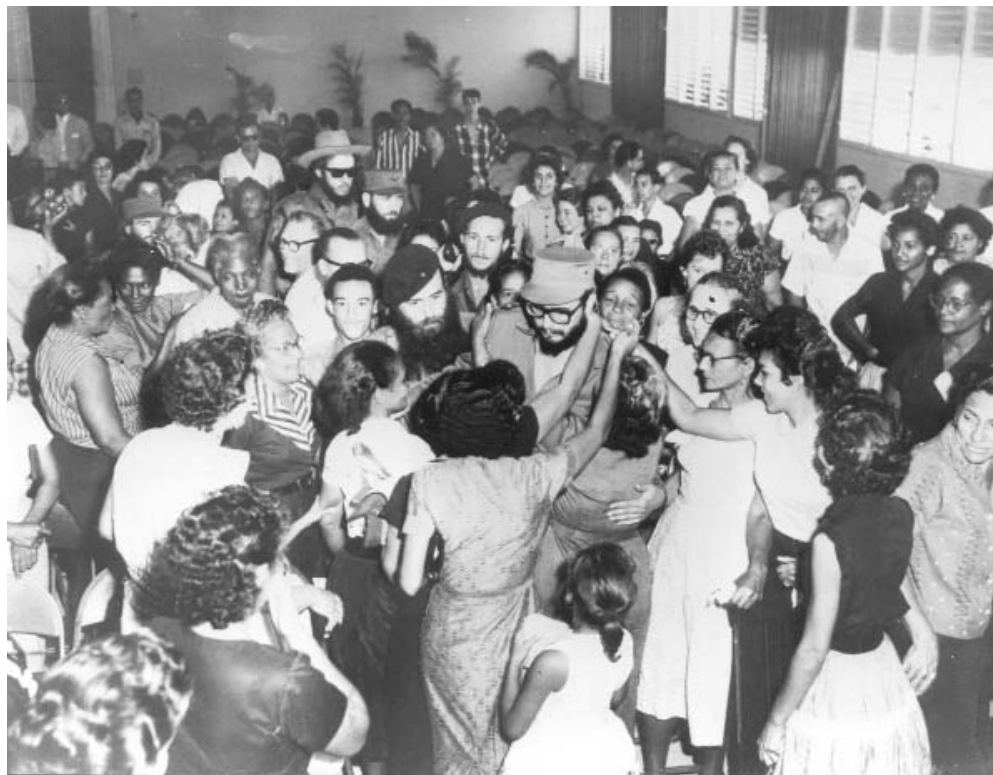
El líder de la Revolución arropado por su pueblo.