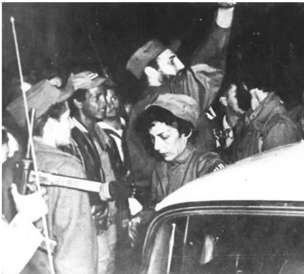
Fidel saluda a sus compatriotas en el día de la victoria.

de enero de 1959 a Santiago de Cuba y se disponían a fundar sobre nuevas bases una República libre y soberana.