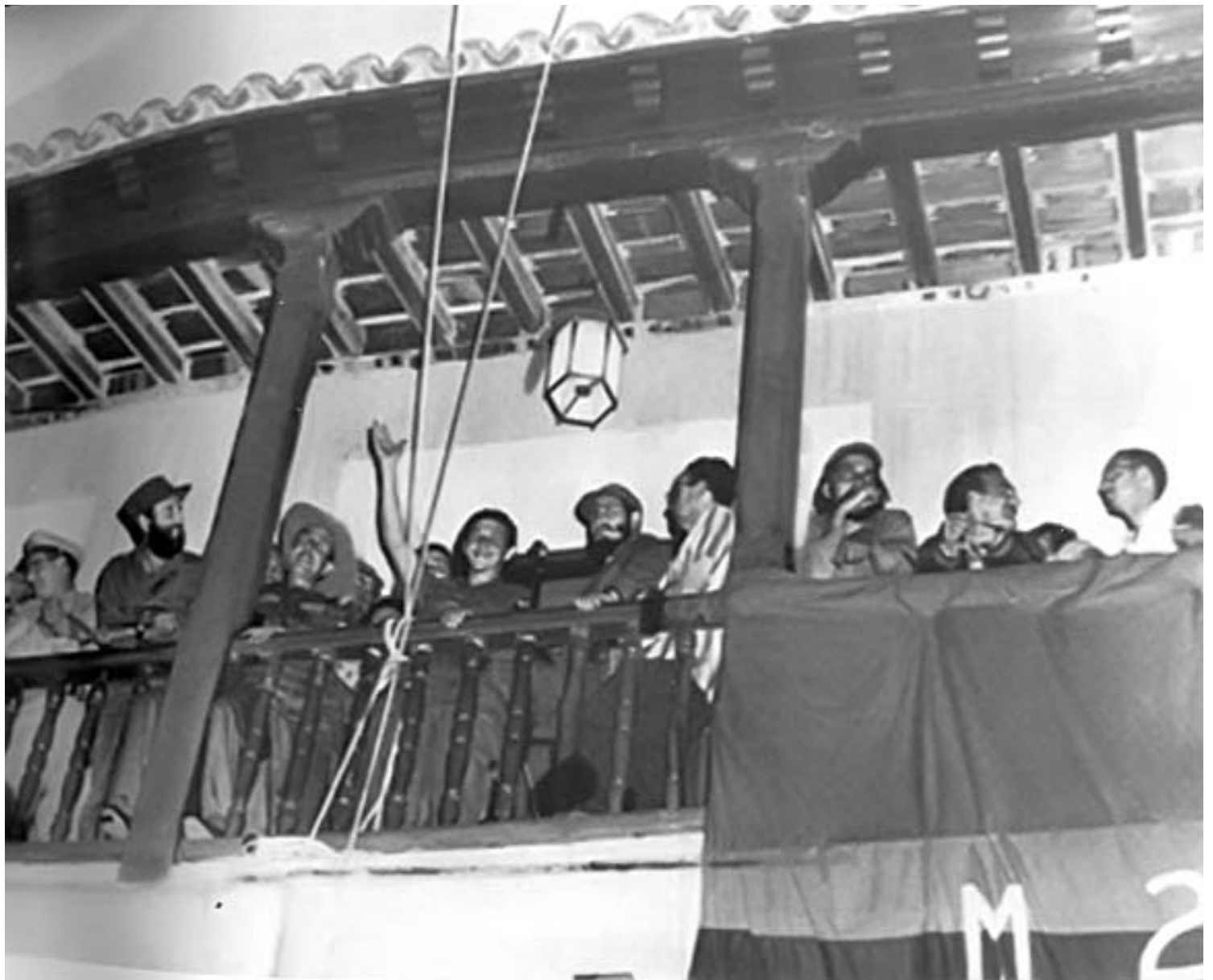
En el ayuntamiento de Santiago, frente al parque Céspedes el Comandante en Jefe Fidel, Raúl y otros revolucionarios saludan al pueblo allí reunido.

Con Fidel al frente, los mambises del siglo XX sí entraban el primero