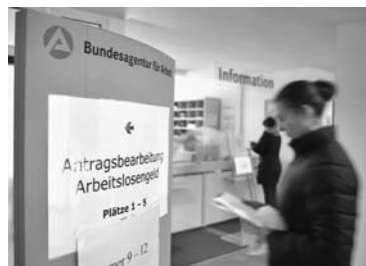
Con este nuevo dato la cifra de desempleados aumentaría de 8 a 9,7 %.

Con fecha de noviembre del 2011, casi 105 000 personas,