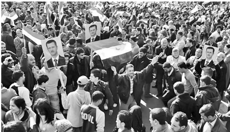
Los sirios exigen sinceridad a los observadores de la Liga Árabe.

El año que está a punto de acabar ha sido horrible para los elefantes, según denuncia el grupo internacional de la vida silvestre Traffic. La organización indica que en el 2011 se incautaron 23 toneladas de marfil, lo que significa que al menos 2 500 animales murieron por causa de la caza furtiva. Esa cifra es la más alta desde 1989, cuando se prohibió el comercio de marfil para salvar a los elefantes de la extinción. Traffic afirma que este año se han hecho por lo menos 13 grandes incautaciones de marfil, en comparación con las siete operaciones que se hicieron en el 2010 en las que se consiguieron diez toneladas de marfil. (BBC mundo)