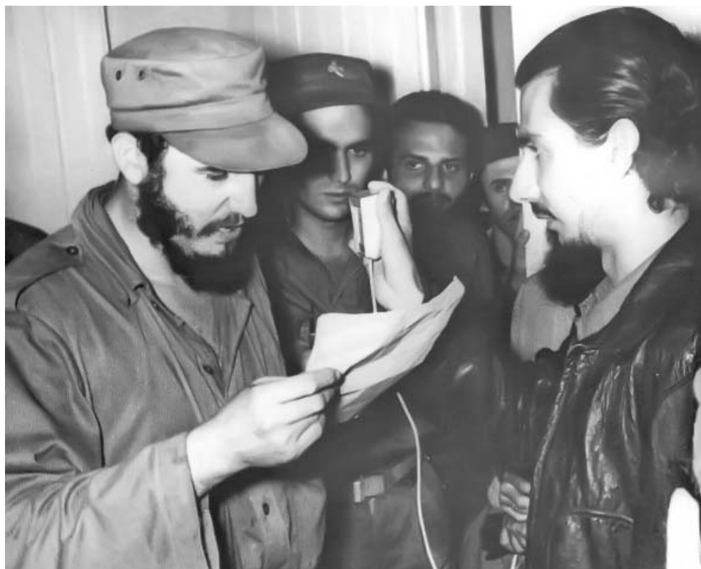
Fidel llama a la Huelga General revolucionaria, desde Palma Soriano, a través de las ondas de Radio Rebelde y otras emisoras.

Estaba en Radio Rebelde. Desde allí se había lanzado ciertas consignas dirigidas a los trabajadores y al pueblo en general; que tuvieran calma, que no destruyeran nada que pudiera afectar los bienes del pueblo. Se dijo que pronto hablaría Fidel. En esa oportunidad estaban