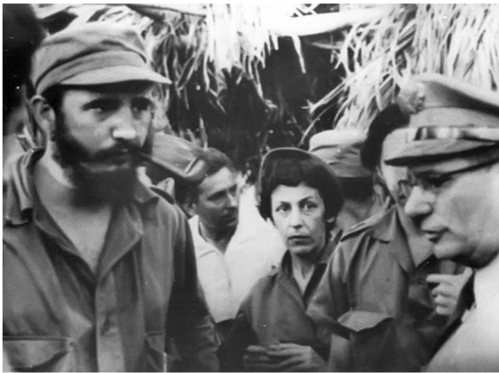
Encuentro en el Escandel, donde se ultiman detalles de la rendición de la plaza militar de Santiago de Cuba. Fidel dialoga con el coronel Rego Rubido, al frente de dicha plaza. Están presentes Raúl y Celia.

llamando desde La Habana. Era el general Cantillo. Cuando Fidel llegó, le decimos: "Cantillo ha estado llamando insistentemente para entrevistarse contigo" (...) Todos los allí presentes estábamos de acuerdo con que Fidel debía contestar, hablar con Cantillo, discutir la situación creada. Y Fidel nos mira y dice: "Yo no estoy loco, ustedes no se dan cuenta de que los locos son los únicos que hablan con cosas inexistentes, y como Cantillo no es el Jefe del Estado Mayor del Ejército, yo no voy a hablar con cosas inexistentes, porque no estoy loco. Todo el poder es para la Revolución". (...) Recuerdo que Fidel traía una minuta en las manos y durante un rato dio zancadas por la habitación y, apoyándose