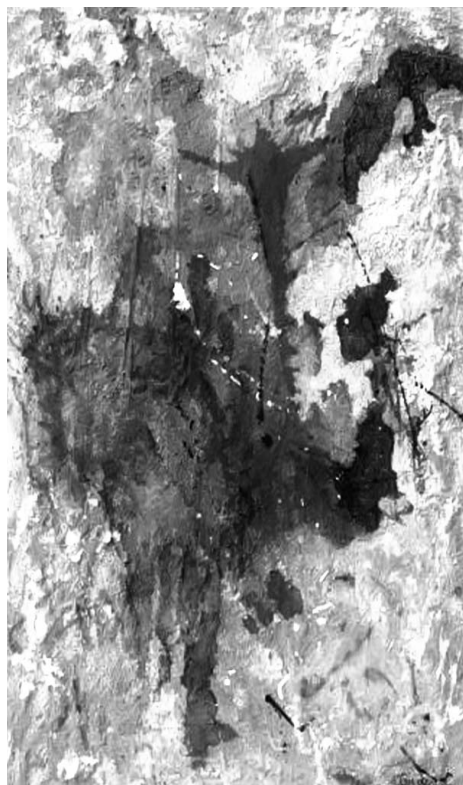
Memorias laceradas, obra de Godoy.

Mediante Memorias , Godoy concentra todavía más su lenguaje en la zona de la abstracción. El poeta y crítico Nelson Herrera Ysla sugiere acercarnos "a cualquiera de sus obras para sentir las vibraciones de un universo pocas veces soñado, donde el informalismo y el ímpetu de lo gestual se adueñan de un espacio pictórico influido por el legado de pintores europeos y norteamer-