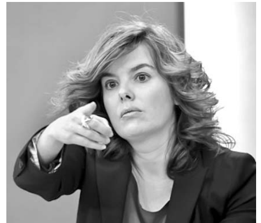
La Vicepresidenta española expresó que "estas medidas son el inicio del inicio" de los recortes.

A pesar de que el presidente Mariano Rajoy había declarado durante su campaña electoral que no subirían los impuestos, sino que bajarían, el titular de Hacienda, Cristóbal Montoro, declaró que la subida impositiva en el Impuesto sobre la Renta de las Personas Físicas se aumentará 0,75 % hasta 7 puntos porcentuales más.