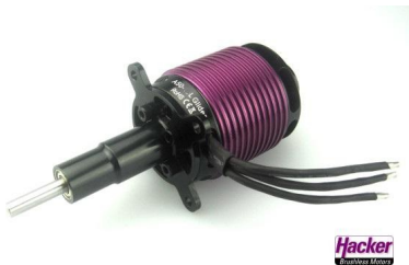
Moteur Hacker A40-10L Turnado Glider