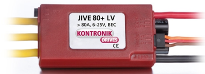
Controleur Jive 80+LV BEC