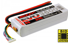
Accu Lipo 6S 3600mah