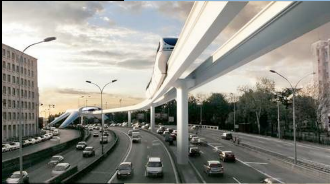
Le projet de train aérien de l'atelier Christian de Portzamparc. (Crédits photo : atelier Christian de Portzamparc)