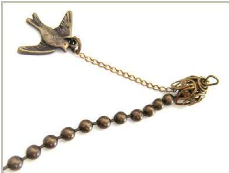
Former une boucle (cf. technique de base sur le blog) En haut de la cloche tulipe