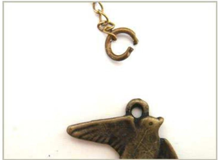
A l'extrémité de la chaine fine placer un anneau de 5mm Et l'hirondelle puis refermer l'anneau