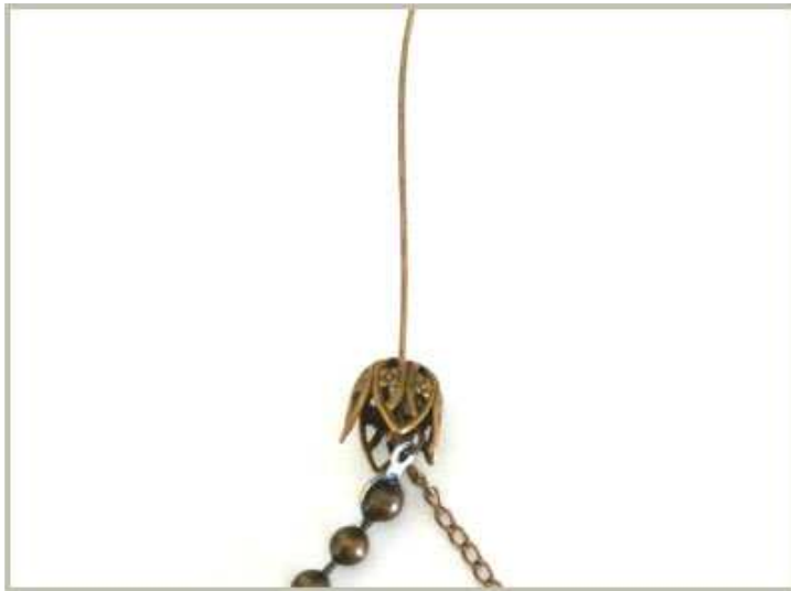
Enfiler la cloche tulipe

1 couper le cache nœud comme sur la photo 1 l'encoller généreusement et y aposer la boule extreme de 9 cm de chaine boule Laisser secher une bonne heure Ouvrir l'œil d'une tige à œil et y placer 5 cm de chaine fine et l'anneau de la chaine boule