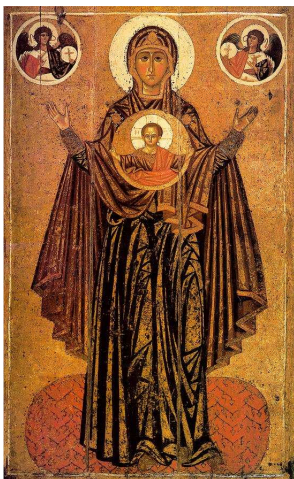
Icône russe représentant la Vierge, aux mains levées avec l'Enfant (12 ème siècle)