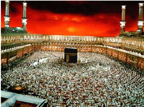
Photographie de la grande mosquée de La Mecque avec la Ka'ba en son centre