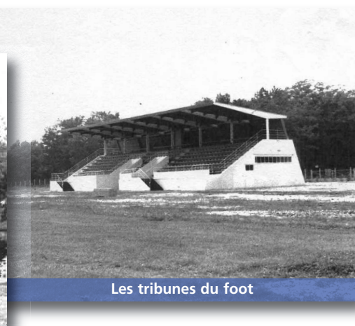
Les tribunes du foot