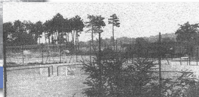
Les tennis et dans le fond, le chantier de construction de la piscine. La création de la Plaine des sports du PINSAN ne peut s'inscrire au bilan du maire actuel.

*cf. Mag'Eysines de juin 2003, Le LIEN EYSINAIS de janvier 2004, Sud-Ouest du 8 août, et rectificatif partiellement erroné du 15 août : courts de tennis, terrain de foot et piscine (en chantier) étaient déjà là. Il est permis de s'interroger quant aux sources de Sud-Ouest.