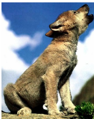
Louveteau d'environ 3 mois

Au printemps, la louve s'installe dans la tanière pour donner naissance à 5 ou 6 louveteaux. Au bout d'un mois environ, ils sortent de la tanière. A l'âge de 5 mois, ils peuvent suivre la meute.