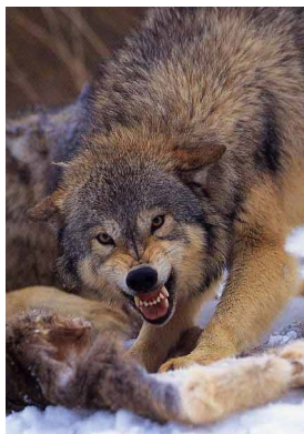
Le loup mange 9 kg de viande par repas

Son pelage est gris, il a de fortes épaules et un cou puissant. Son museau est pointu, ses oreilles restent toujours droites mais sa queue est pendante.