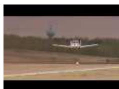
La voiture volante bientôt homologuée aux États-Unis