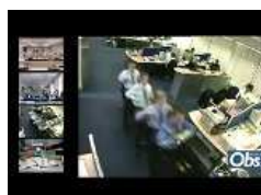
Faites du sport au bureau...

CHOMAGE 9,5 % INFLATION + 1,7 % CROISSANCE + 1,7 %