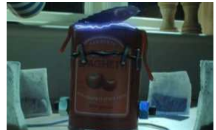
Combats de choses : la conserve versus les choux de Bruxelles