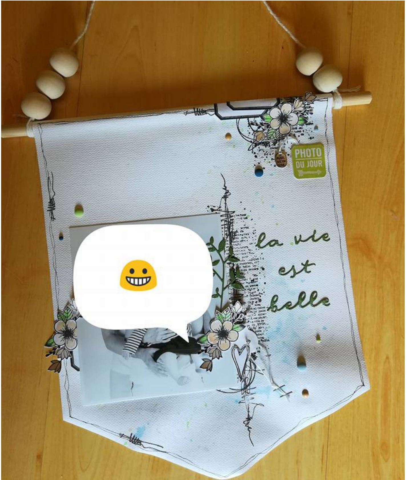
PHOTO DU JOUR