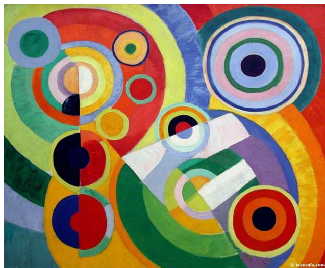
Robert Delaunay, Joie de Vivre , 1911

Né au début du XX ème siècle, l'art abstrait s'oppose, par définition, à l'art figuratif qui régnait jusqu'alors. Les arts plastiques se devaient d'être en effet représentatifs, d'imiter la nature. Il était inconcevable qu'un peintre ou un sculpteur s'aventure à créer une œuvre dont on ne puisse, au premier regard, reconnaître le sujet. Pourtant un certain nombre d'artistes s'accordèrent à penser qu'il existait bien une autre vérité de la peinture et qu'il convenait de la révéler au grand public. Ainsi en 1911, l'une des plus illustre figure de l'abstraction, Wassily Kandinsky fonde en 1911 avec Franz Marc le BLAUE REITER (le cavalier bleu), bien décidés à « montrer par la variété des formes représentées à quel point les aspirations intérieures des artistes peuvent s'exprimer diversement ».