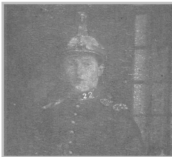
Un millierain avec le casque de 1870 modifié

Loi n°2004-811 du 13 août 2004 de modernisation de la sécurité civile.