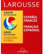
francés y español