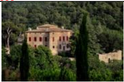
Vauvenargues en Francia