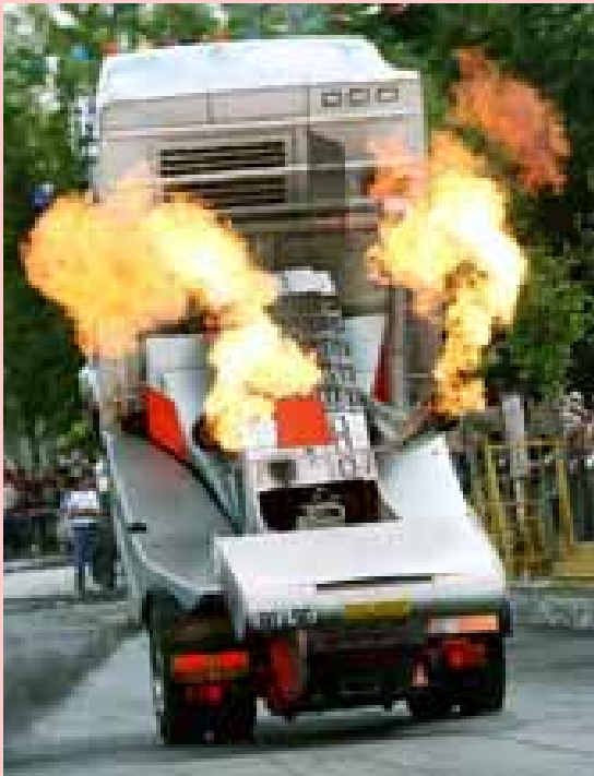
Mathéo 9 ans

Les camions qui se cabrent sont des camions comme les autres. Mais ils se cabrent ! Pour qu'un camion se cabre, il avance à toute vitesse, il freine avec les freins arrière et le camion se cabre ! Après ils avancent en dépassant des bornes indiquant les mètres qu'ils font.