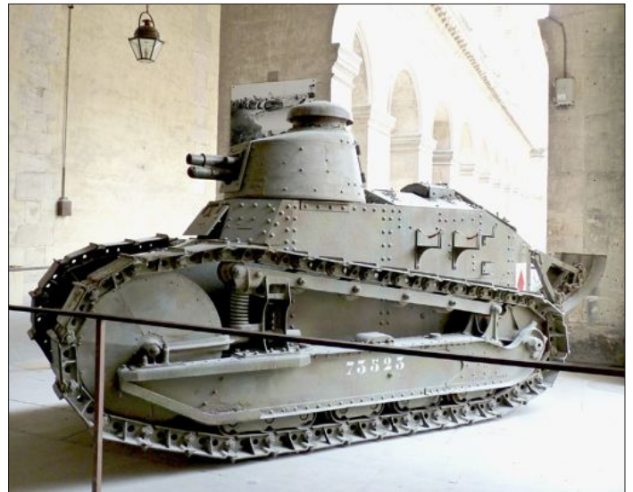
1 Char Renault FT 17, cour d'honneur, au pied de l'escalier G © Paris, musée de l'Armée.

Dès 1915, Anglais et Français entreprennent l'étude d'un engin qui permettrait de sortir des tranchées pour reprendre l'offensive, tandis que les Allemands s'orientent vers un emploi maximum des possibilités de l'artillerie. Les Anglais utilisent les premiers « tanks » en septembre 1916, sur la Somme, mais leur manque de fiabilité et un mauvais emploi tactique se soldent par un échec.