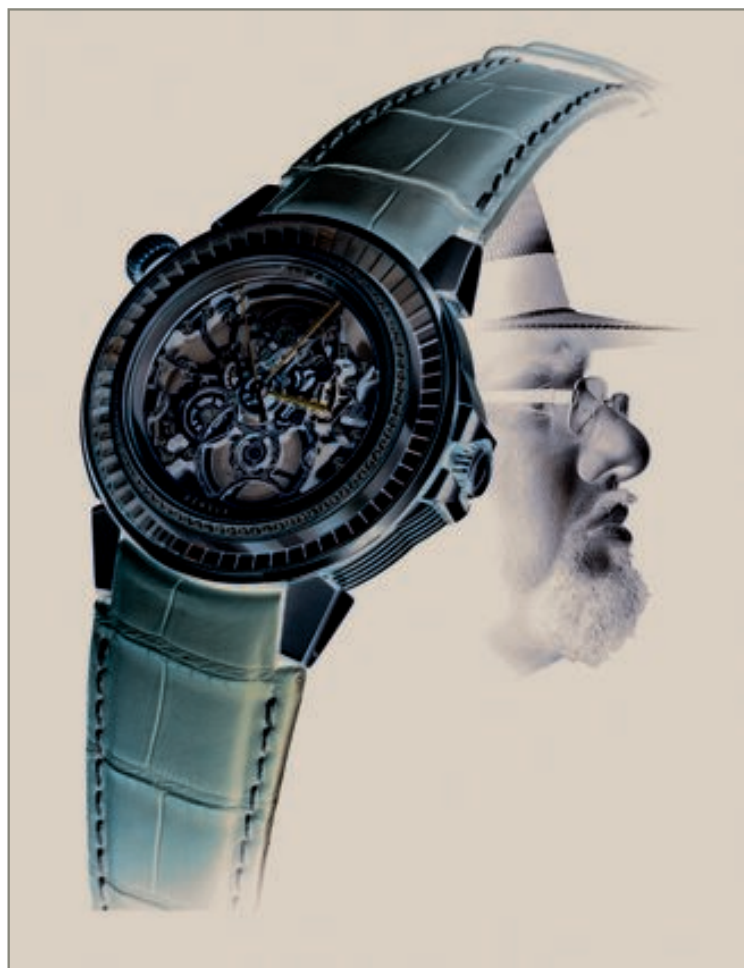
Michaël Bittel, l'horloger du voyage, plus que jamais en verve créatrice.