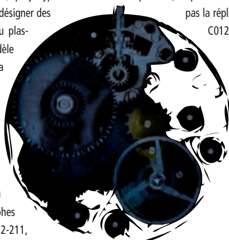
L'Astrolon, fruit des recherches de Tissot dans les années 70.

D'où viennent ces mots étranges, appelés à désigner des matières inaltérables, savantes variantes du plastique? Du descriptif de l'Astrolon 2250, modèle équipé du visionnaire mouvement né il y a une quarantaine d'années. Son nom de code était aussi le Tissot SYTAL (contraction de Système Total AutoLubrification). Le JSH – Journal Suisse d'Horlogerie écrivait ceci en 1973: «Montre de qualité, de fabrication simplifiée dans la ligne des nécessités économiques de notre temps.» A l'heure où la marque Tissot insère dans ses chronographes automatiques son propre calibre, le C012-211, impossible de ne pas reconnaître à l'Astrolon 2250 son avant-gardisme. Eût-il même une