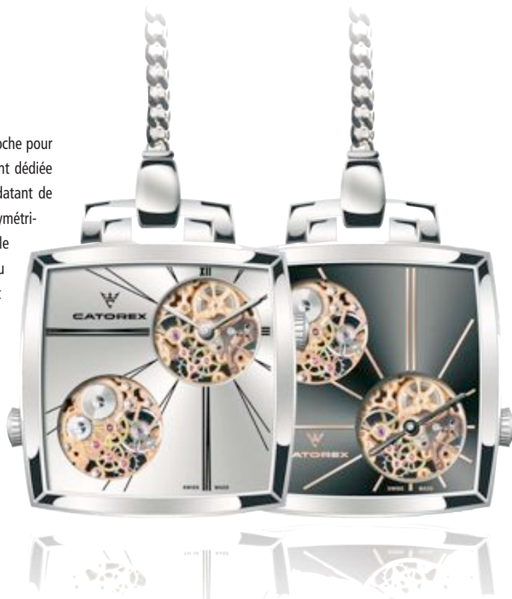
Catorex joue avec les références des montres de poche.