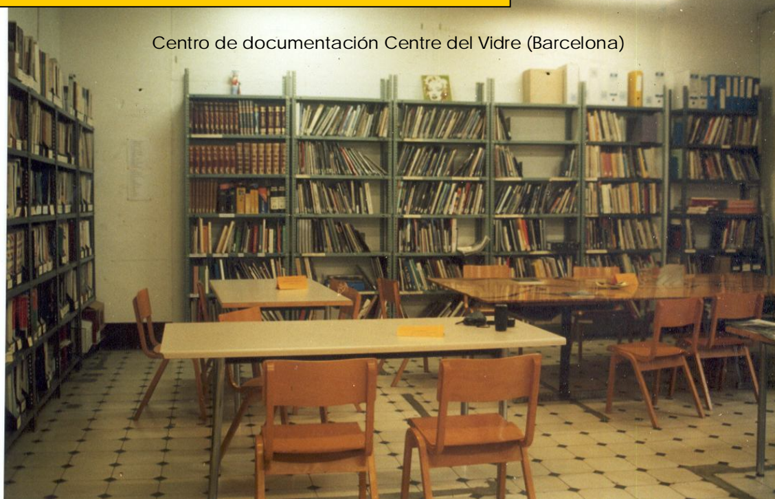
Centro de documentación Centre del Vidre (Barcelona)