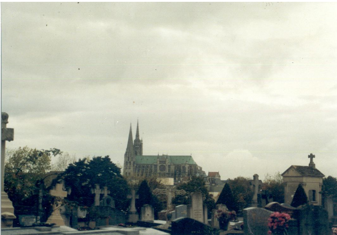
Catedral de Chartres

En Chartres el conjunto de vitrales originales debe ser uno de los mas completos en el mundo, en ellos se cuenta la historia del antiguo testamento, la pasión de cristo, la vida de los apóstoles, durante los periodos de guerra los paneles fueron desmontados y cuidadosamente protegidos. En cuanto a la Catedral de Paris; fue remodelada, incluidos sus vitrales, por el arquitecto y restaurador del siglo XIX Eugenio Viollet-le-duc.