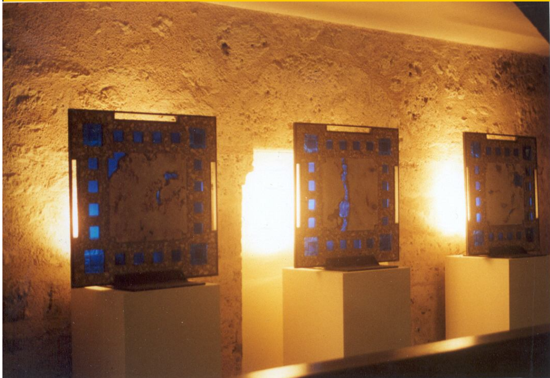
Exposición Lumière de Chartres et d'Eure-et-Loir, Vitraux Centre international du vitrail