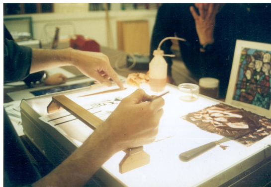
Preparación de la grisalla

Cuando se trabaja un oficio antiguo, uno termina por comprender, que la manera de mantener la vigencia del mismo, es a través de tres medios fundamentales: La conservación del patrimonio, la creación contemporánea y la formación y difusión del oficio. Si para algunos, cabe la duda, de si la tradición del vitral nos concierne (en el contexto local), tendrían que hacerse la misma pregunta con respecto a la pintura y la historia del arte.