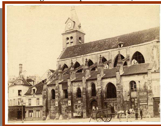
Ancienne Eglise Notre-Dame de Meulan aujourd'hui remplacée par l'Hôtel de Ville