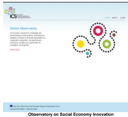
Observatory on Social Economy Innovation

L'objectif principal de cet outil en ligne est d'informer le public visé des innovations dans le domaine de l'économie sociale.