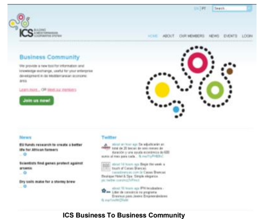
ICS Business To Business Community

La cible principale de cet outil est de promouvoir la coopération entre ses membres et d'être une source essentielle d'information sur tous les aspects de développement des coopératives MED.