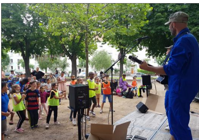
Le vendredi 9 juillet, la compagnie Les Contes de Nana a animé la place Hauger avec un concert festif.