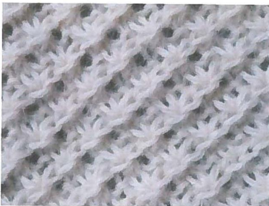
Endroit du travail (avec ces jolies étoiles ouvertes)