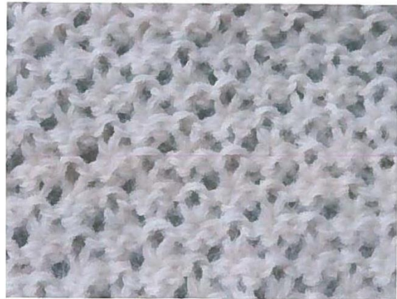
Envers du travail ... plutôt joli quand même !