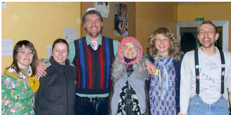
La fine équipe du bureau de l'APE !