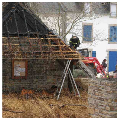
Intervention des pompiers à la Chaumière

Les pompiers ont eu du mal à éteindre le feu car il avait bien pris. Ils ont dû enlever toute la paille. Les gendarmes font une enquête pour trouver le coupable.