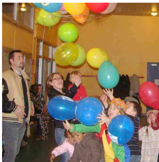
Toujours un moment fort : le lâché de ballons!