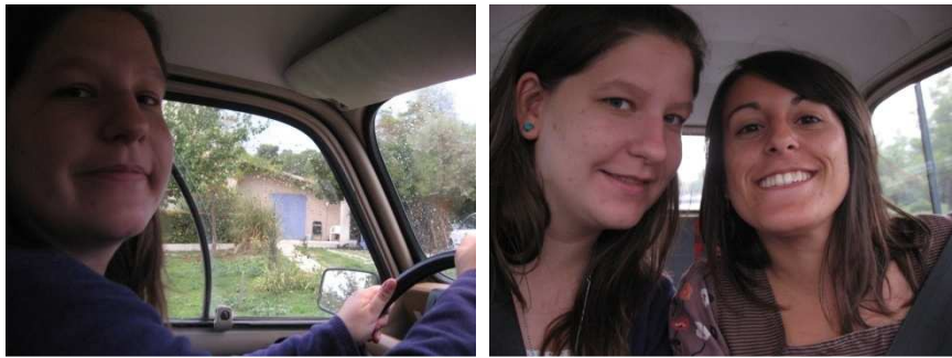
Première photo de l'équipage au complet !

Nous avons également fait notre premier vide-grenier ensemble.