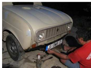
Repose provisoire de la plaque d'immatriculation