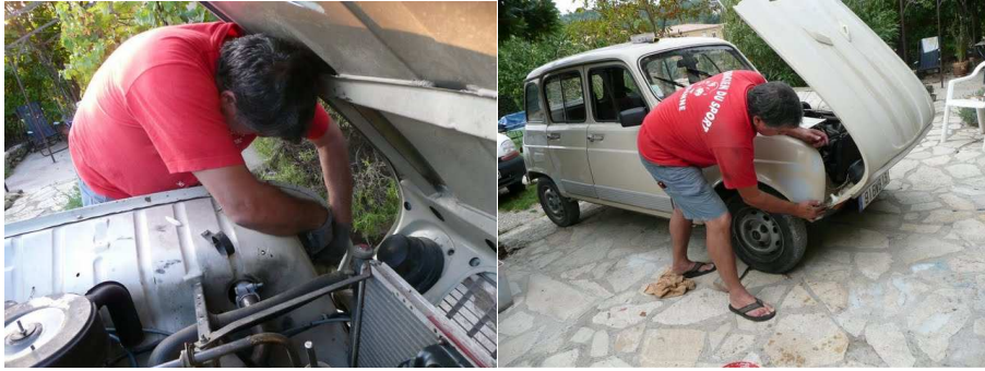
Décabosser, mastiquer, poncer...