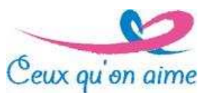
L'association Ceux qu'on aime