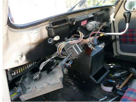
Démontage du tableau de bord...