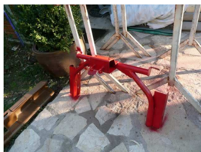
L'attelage repeint à neuf