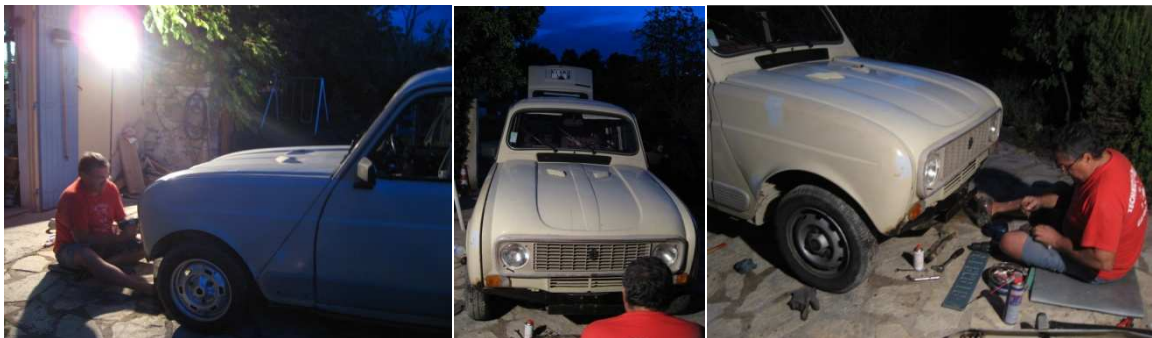
Démontage du pare-choc avant pour la réparation des ailes trouées