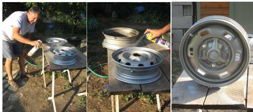
La (nécessaire) bombe anti-rouille pour les roues

Il a également démonté le tableau de bord original pour monter le nouveau, celui qu'il avait préparé le mois dernier. Sur celui-ci, nous avons maintenant un allume-cigare, une petite lampe pour lire le road-book, un compteur pour la température du moteur, pour la tension et une horloge. Il a installé le volant « racing » et peint l'attelage.