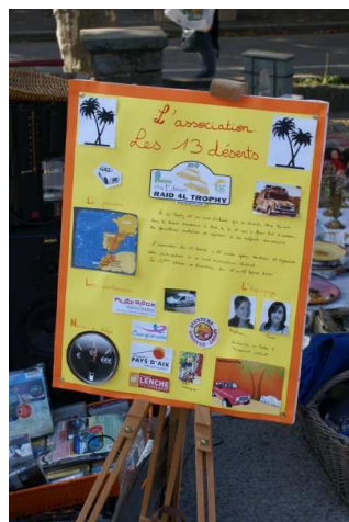
Une nouveauté : le tableau de présentation !

Il n'y a pas eu beaucoup de personnes à notre vide-grenier, peut-être à cause du grand nombre de brocantes et vide-greniers ce jour-là dans le département... Mais nous avons tout de même récolté 51€60 !