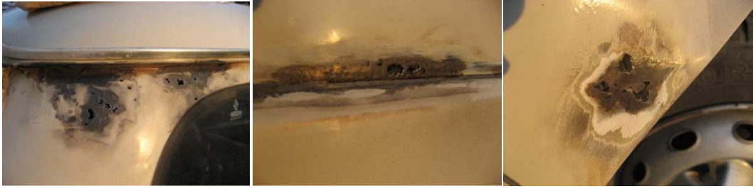
La carrosserie avant réparation ♪ Des p'tits trous, des p'tits trous, encore des p'tits trous ... ♪