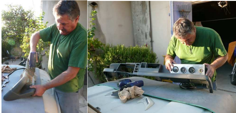
Découpe de la planche de bord et installation des mannos