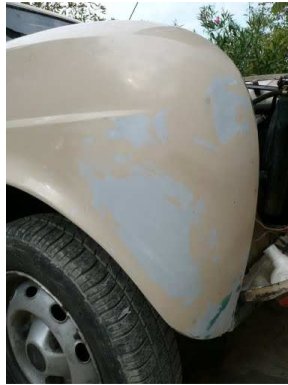
Comme neuve, les trous ont disparu... magique !