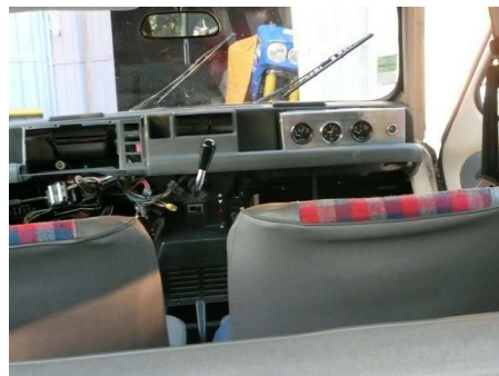
Un petit aperçu de ce que ça donnera pour le raid