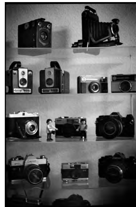
FP4+ développé au Caffenol. Un des clichés de ce film.