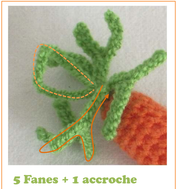
5 Fanes + 1 accroche