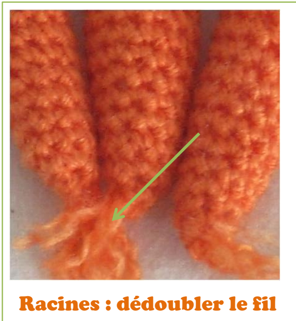
Racines : dédoubler le fil