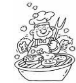
Mardi 2 juillet