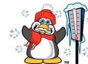
vendredi 5 juillet