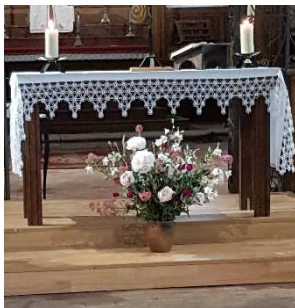
Plessis-Grohan le 20/06/2021

Un grand merci à toutes celles et tous ceux qui nettoient et fleurissent nos églises, préparent et animent les célébrations.