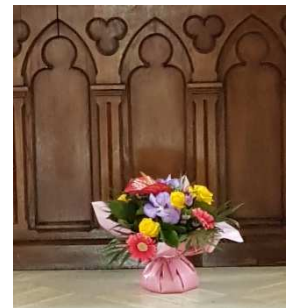
St Aubin le 11/07/2021

Un grand merci à toutes celles et tous ceux qui nettoient et fleurissent nos églises, préparent et animent les célébrations.