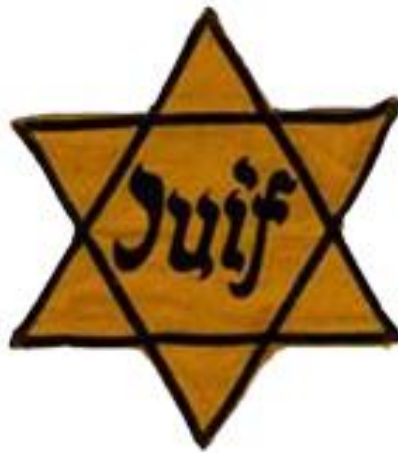
Document 3 : Une étoile jaune.

Répondre aux questions à partir des documents ci-dessus :