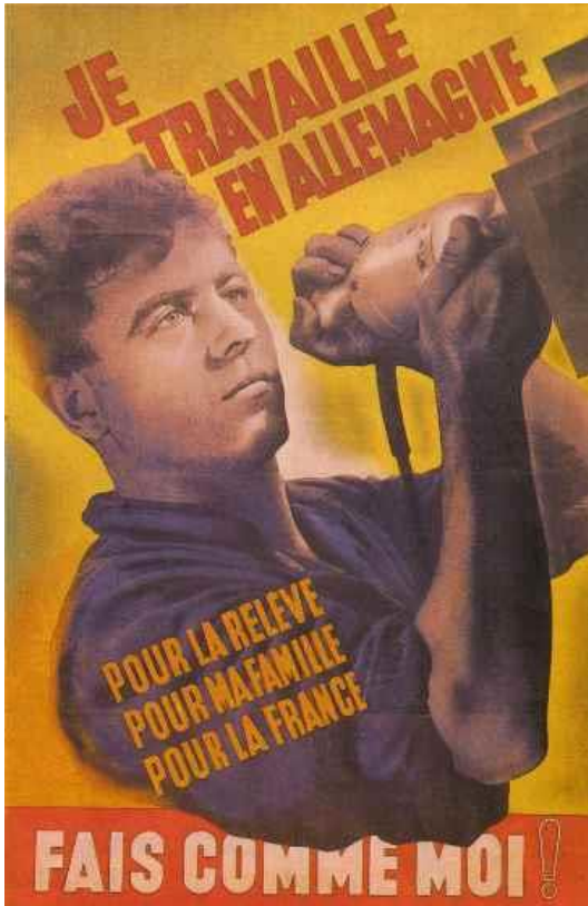
Document 1 : Affiche de propagande pour le travail en Allemagne.