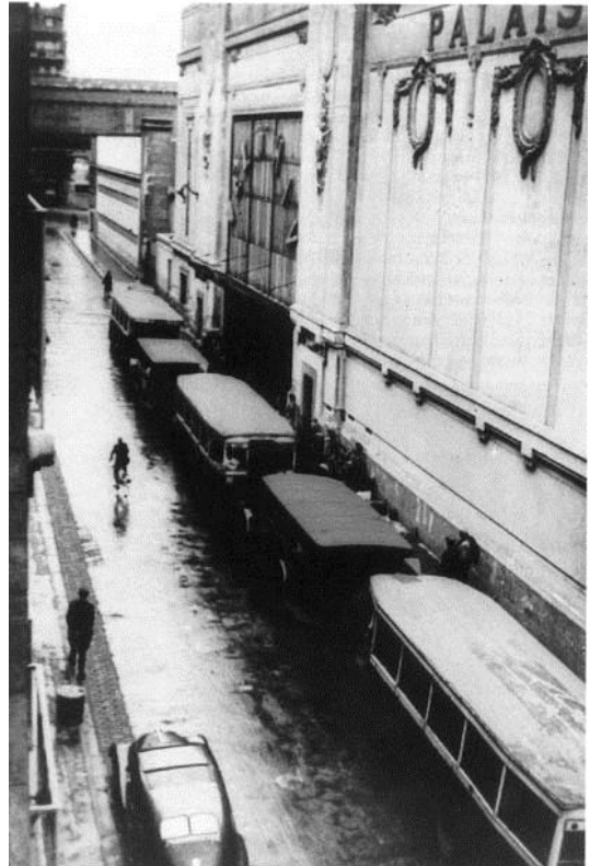
Document 2 : La rafle du Vel-d'hiv les 16 et 17 juillet 1942. Les juifs furent conduits au Vel-d'hiv avant d'être déportés.