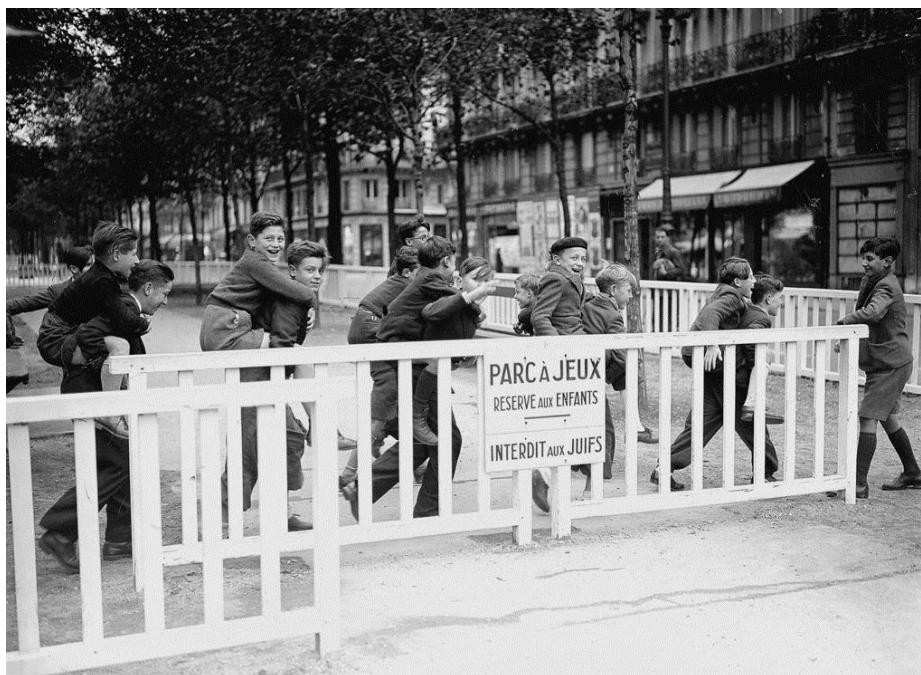
Document 3 : Un parc à Paris en 1942.

Répondre aux questions à partir des documents ci-dessus :