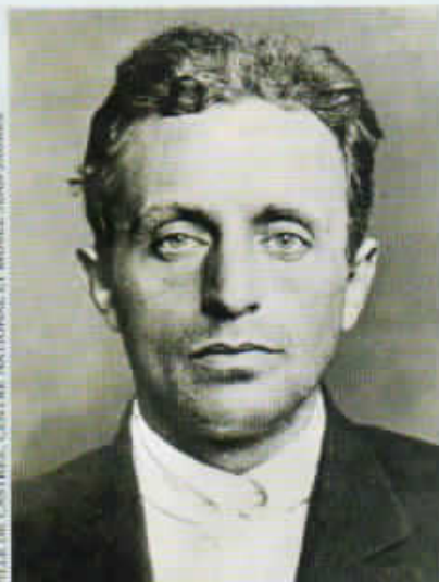
Procès Prévû en 1915, le procès de Raoul Villain n'eut lieu qu'en 1919.

Villain savait que Jaurès s'était opposé au service militaire de trois ans et qu'il avait brandi la menace de la grève contre la guerre. Il le vit dès lors comme « la grande gueule » à abattre. Après avoir assisté à des manifestations antimilitaristes à Paris le 29 juillet 1914, sa colère contre Jaurès s'amplifia. Il acheta un Smith et Wesson et, le 31, à 21 h 40, il accomplit l'irréparable au Café du Croissant où Jaurès dînait en compagnie d'une douzaine d'amis. Il fut aussitôt arrêté.