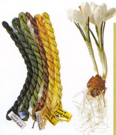
Échevettes de coton accompagnées d'un crocus à partir duquel on obtient le jaune safran.

C'est vrai qu'il est, a priori, plus facile de jeter une capsule dans sa machine à laver pour changer la couleur d'un drap ou d'une nappe dont on s'est lassé! Alors pourquoi opter pour la teinture végétale qui demande plus de temps et de minutie? D'abord parce que cette technique qui est dans l'air