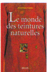
«Le monde des teintures naturelles», Dominique Cardon, Belin. Ce livre retrace les diverses techniques de teintures naturelles. Le guide des «Plantes colorantes, teintures végétales, le