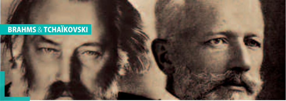
Tchaikovsky / Brahms