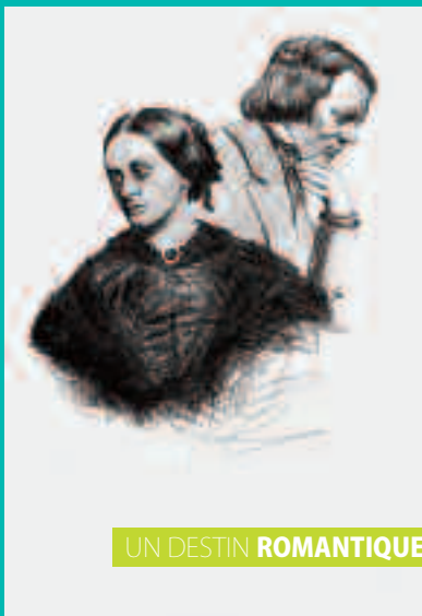
© Tibo Zuccari d'après un daguerstypage de 1857 et d'une photo de Franz Hanfstaengl

TARIFS ADAC 16€ / 13€ / 5€ /// INFOS RÉSA 03 26 35 61 45