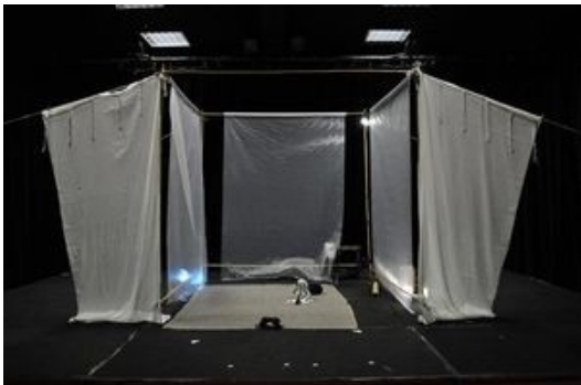
Structure en bambou (2m sur 2m)