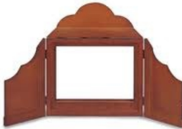
Butai (support des planches kamishibai)