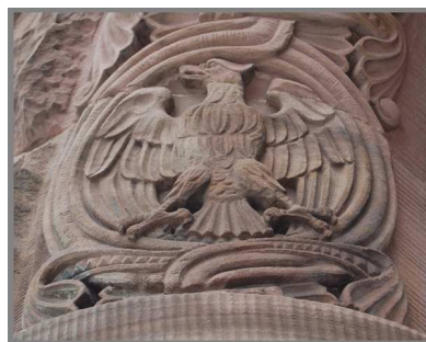
L'Aigle impériale de la Grande Poste de Metz

Les Journées d'études mosellanes seront l'occasion d'évoquer les débuts de la Gesellschaft , dans un contexte de résistance à la germanisation de la part des élites francophones et francophiles ; de souligner le rôle d'érudits tels que Georg Wolfram, archiviste départemental, ou Johann Baptist Keune, conservateur du musée de Metz. La bibliothèque municipale de Metz doit aussi une partie de ses collections les plus originales, parfois uniques en France, à la gestion allemande de l'établissement entre 1871 et 1918.