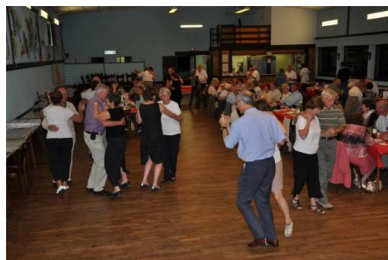
L'ambiance de la soirée les cousins dansent sur les rythmes endiablés de l'orchestre Alsacien