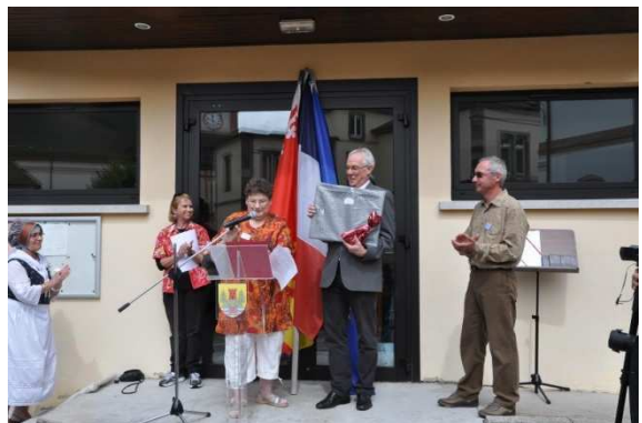
Les discours, remise de cadeaux à monsieur le Maire de Kruth