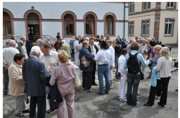
Pendant le vin d'honneur dans la cour de l'école de Kruth