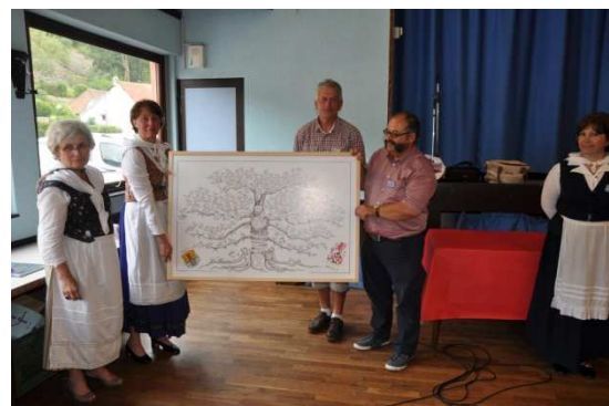
L'un des plus beaux arbres généalogiques ARNOLD