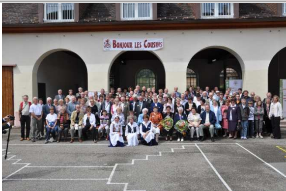
cousinade 2011 la grande photo de famille ARNOLD Devant le préau de l'école à KRUTH

ÉDITÉ PAR L'ASSOCIATION INTERNATIONALE DES FAMILLES ARNOLD ET ALLIÉES (loi 1901 déclarée à la S/Préfecture de Mantes la Jolie sous le n° 0781006877)