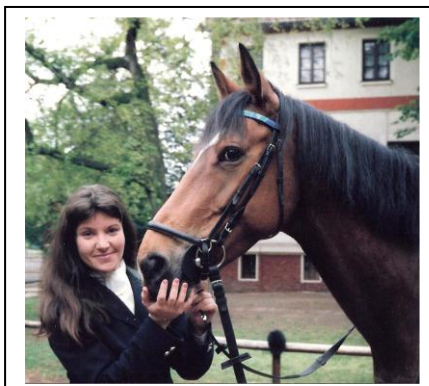
Nankéou, mon grand amour !