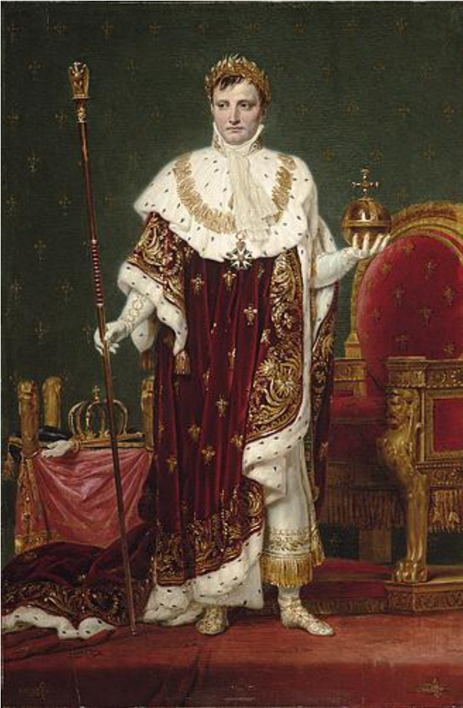
Modello d'un portrait de l'Empereur Napoléon, par David. 1807.