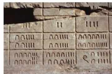
Temple d'Amon à Karnak, en Égypte

* À l'époque des pharaons (3 000 ans avant J.-C.), les Égyptiens utilisaient des hiéroglyphes pour désigner les nombres.