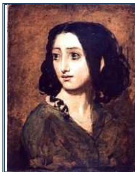
Rachel FELIX vers 1840

http://judaisme.sdv.fr/perso/rachel/musee.htm http://en.wikipedia.org/wiki/Rachel