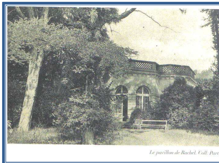
Le pavillon de Rachel.

Une grande tragédienne, une comédienne exceptionnelle venait de rendre l'âme pour la plus grande douleur de ses admirateurs et de ses amis. Elle sera inhumée au Père Lachaise et Alexandre DUMAS Père portera l'un des cordons de son cercueil en souvenir de leur amitié et étant l'un de ses plus fervents admirateurs. ( Tombe 23 Division 7 dans le carré juif au Père Lachaise ).