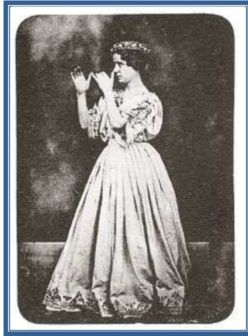
Très drôle portrait de RACHEL où elle fait un pied de nez .. Pour un de ses rôles..