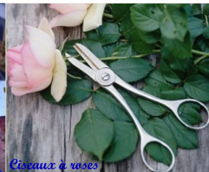
Ciseaux à roses

conçus tout spécialement pour composer des bouquets de roses coupent et serrent la tige de la fleur, en un seul geste.