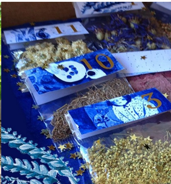
Calendrier de l'Avent garni de fleurs, de graines, de fruits et d'épices ! https://aurasdespaquerettes.com/produit/calendrier-de-lavent/