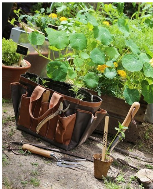
Sac de jardinage toujours à portée de main https://www.natureetdecouvertes.com/jardin/jardinage/outillage-accessoires-jardinage/sac-de-jardinage-50162790

La voie lactée bien blanche et claire en décembre, est semée de blé et de fruit.*