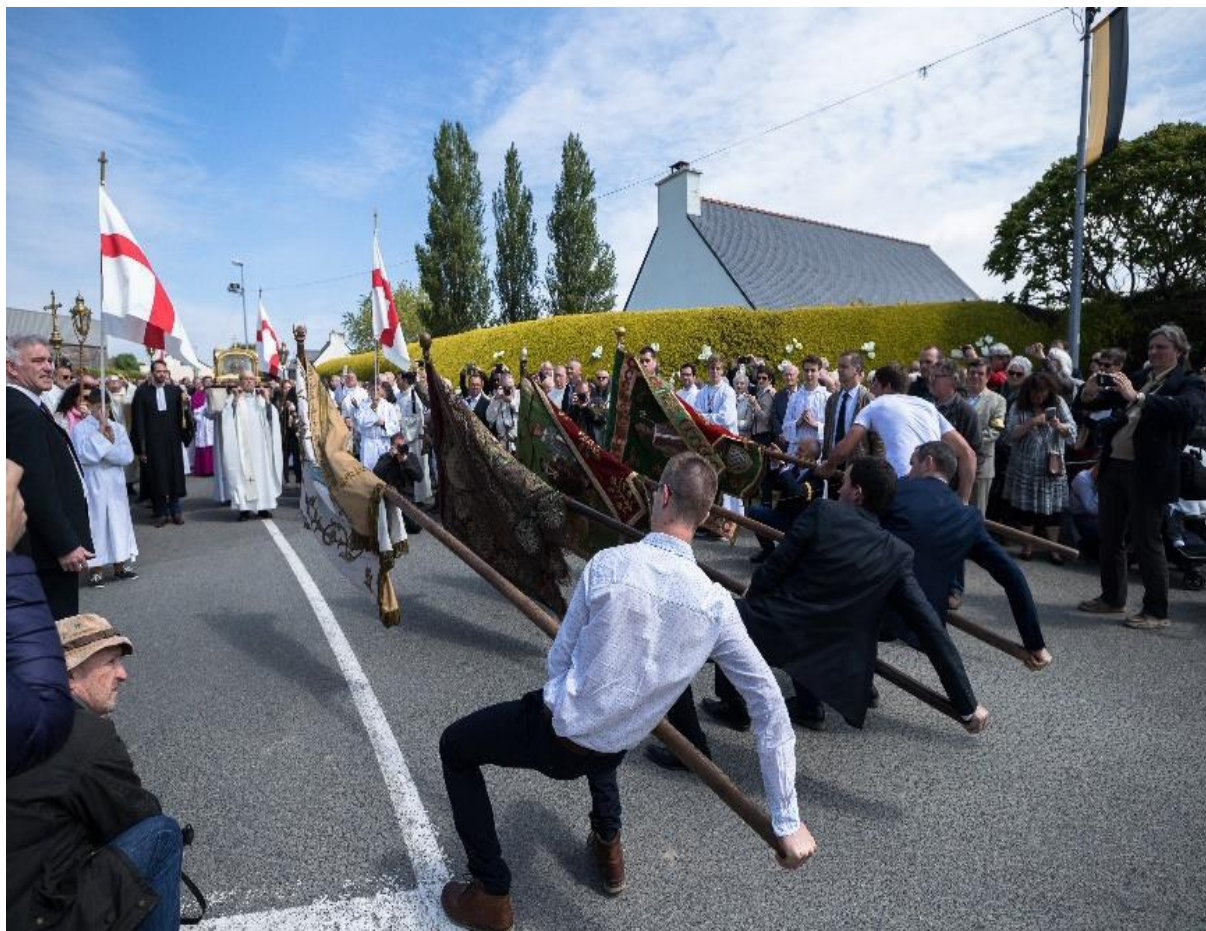
Ill. 6. Le salut des bannières au pardon de saint Yves, Tréguier (Côtes d'Armor)

Les bannières peuvent s'incliner dans d'autres circonstances encore, pour entrer dans l'église à la fin de la procession, tout en restant déployées, ou bien par signe de respect devant une insigne relique. L'exemple le plus fameux de nos jours est celui de Tréguier (Côtes-d'Armor), où elles sont inclinées devant la relique de saint Yves [ill. 6], un moment très attendu de nombreux photographes. Le geste est répété quelques jours avant.