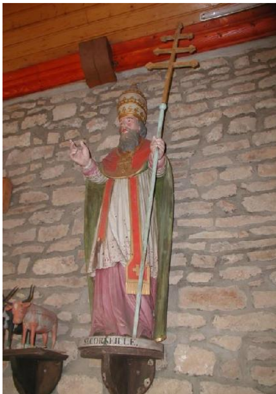
III. 16. Statue de saint Cornély et ses bœufs (fin XVII e siècle), à Chapelle Saint-Mélec-Lanvaudan (Morbihan). © Diego Mens, 2011.

Quand ces statues ne représentent pas le saint dédicataire, elles peuvent être également portées lors de la procession, mais dans un rôle secondaire. La statue du saint vétérinaire est parfois remplacée par un reliquaire porté en procession (chapelle Saint-Guénoé à Quistinic, Morbihan).