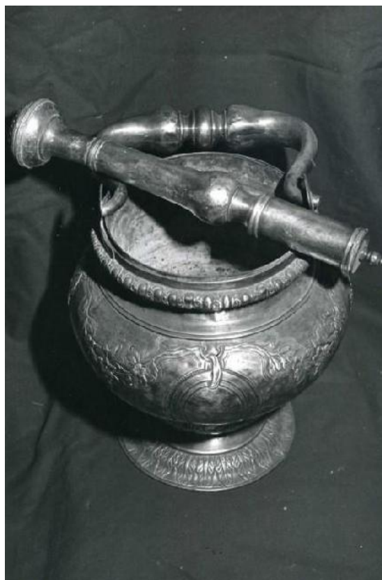
III. 15. Seau à aspersion et son goupillon (1753), Plumelin (Morbihan).

Les croix de procession, dans une majorité des cas, sont assez simples et datent du XIX e ou XX e siècle. Les pièces les plus précieuses et anciennes sont conservées dans l'église paroissiale, tandis que celles des chapelles sont plus modestes et réalisées souvent en métal. Toutefois, dans certains cas, ces pièces peuvent être anciennes et composées de feuilles d'argent sur âme de bois (par exemple, croix de procession de la chapelle de Notre-Dame de la Houssaye à Noyal-Pontivy (Morbihan) datant du XVI e siècle). Ces pièces, comme les calices ou ciboires, ont échappé aux saisies révolutionnaires, et composent aujourd'hui un corpus réduit, face à la grande majorité des croix de procession en métal.