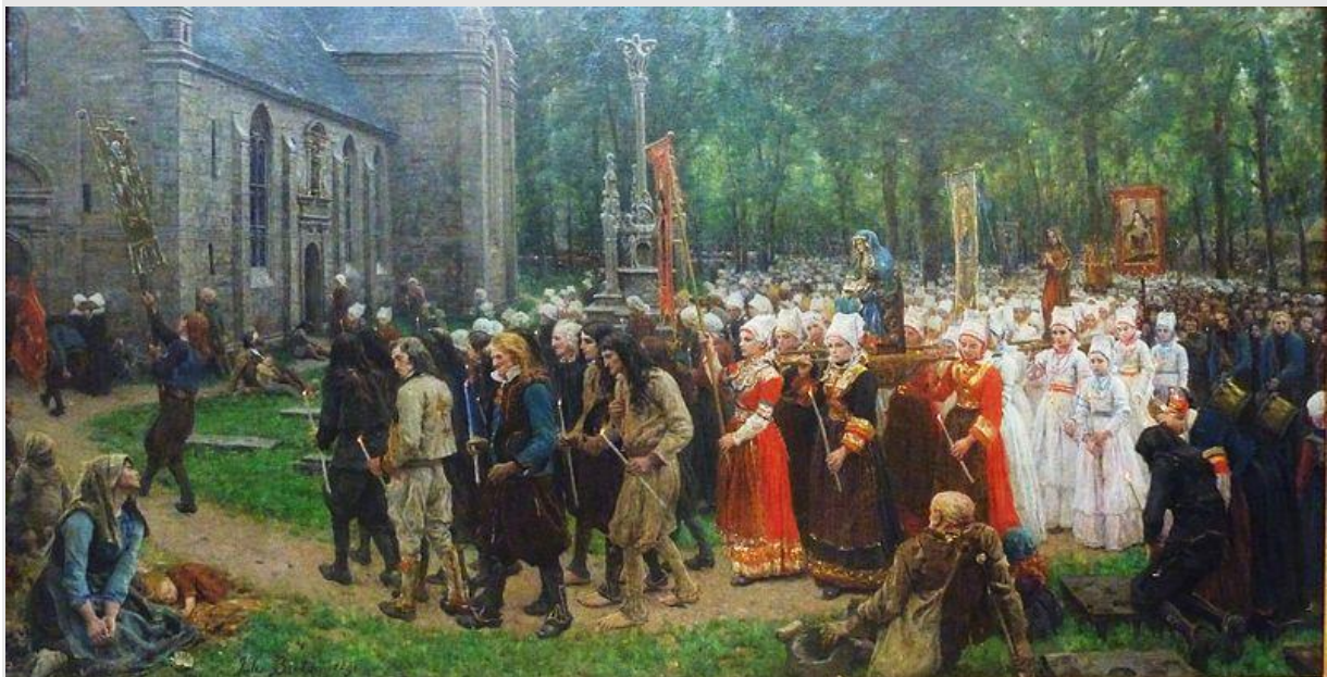
Ill. 19. Pardon de Kergoat en Quéménéven de Jules Breton, 1891. Coll. Musée des Beaux-Arts de Quimper

Au XIX e siècle, les pardons acquièrent une visibilité extérieure sans précédent à la faveur d'éléments nouveaux avec la présence et l'intérêt d'observateurs extérieurs, écrivains ou artistes, en quête d'authenticité celtique. Tous sont séduits par l'originalité de ces rassemblements – grandioses ou plus intimistes – où s'affichent les signes d'une identité spécifique : la langue, les costumes (qui n'ont jamais été plus divers qu'au XIX e siècle), les bannières, les danses et les luttes, les chanteurs ambulants, les boutiques foraines, les mendiants [ill. 19].