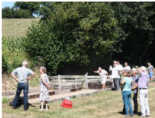
III. 12a. Concours de boules bretonnes, pardon de Locmaria à Langoëlan (Morbihan).

Durant l'après-midi, entre deux activités, certains organisateurs proposent la vente de crêpes et/ou gâteaux. Un repas de crêpes peut également être proposé le soir et les festivités se poursuivre jusque tard dans la nuit.