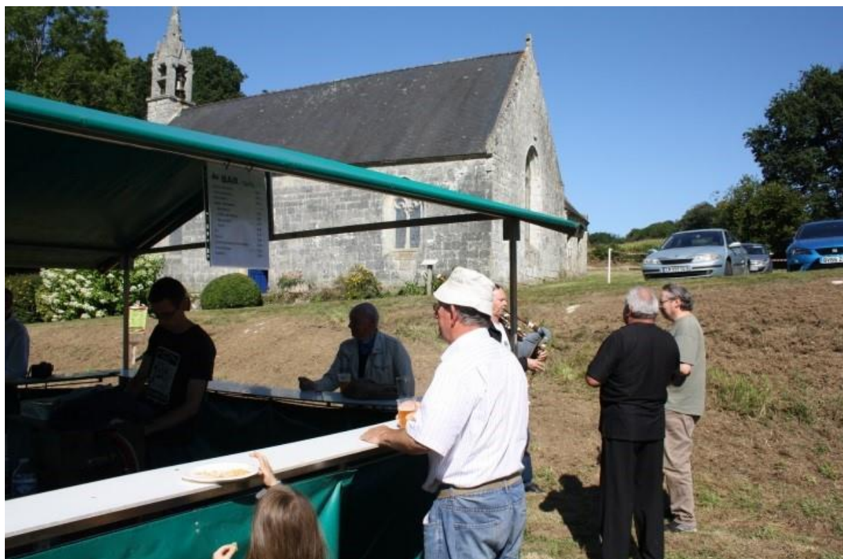
Ill. 9. Buvette installée sur le site de la chapelle, pardon de Locmaria à Langoëlan (Morbihan).

Quand il n'y a pas de repas organisé, la plupart du temps, un verre de l'amitié (apéritif, café, gâteaux, crêpes) est organisé, offert par le comité de la chapelle, le comité de la paroisse ou parfois même la municipalité. Sinon, une buvette est installée [ill. 9].