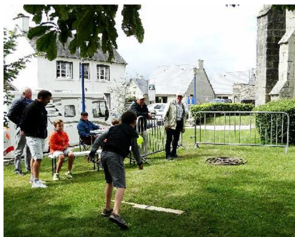
III.12d. Jeu de palet, pardon de Coat Keo à Scrignac (Finistère). © Anne Diaz, 2019.