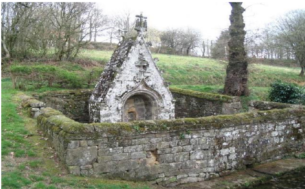
III. 13. Fontaine de Locmaria à Melrand (Morbihan).

Dans une conception standardisée de l'espace d'une chapelle, la fontaine est en revanche essentielle dans la pratique du pardon [III. 13] . C'est le point B de la procession au départ de la chapelle qui compose le point A. Dans une majorité des cas, la chapelle et la fontaine sont contemporaines, dans leur première phase architecturale, notamment pour les édifices construits aux XVI e et XVII e siècles. Cette fontaine est généralement à flanc de colline ou à sa base, avec une alimentation d'une source permanente.