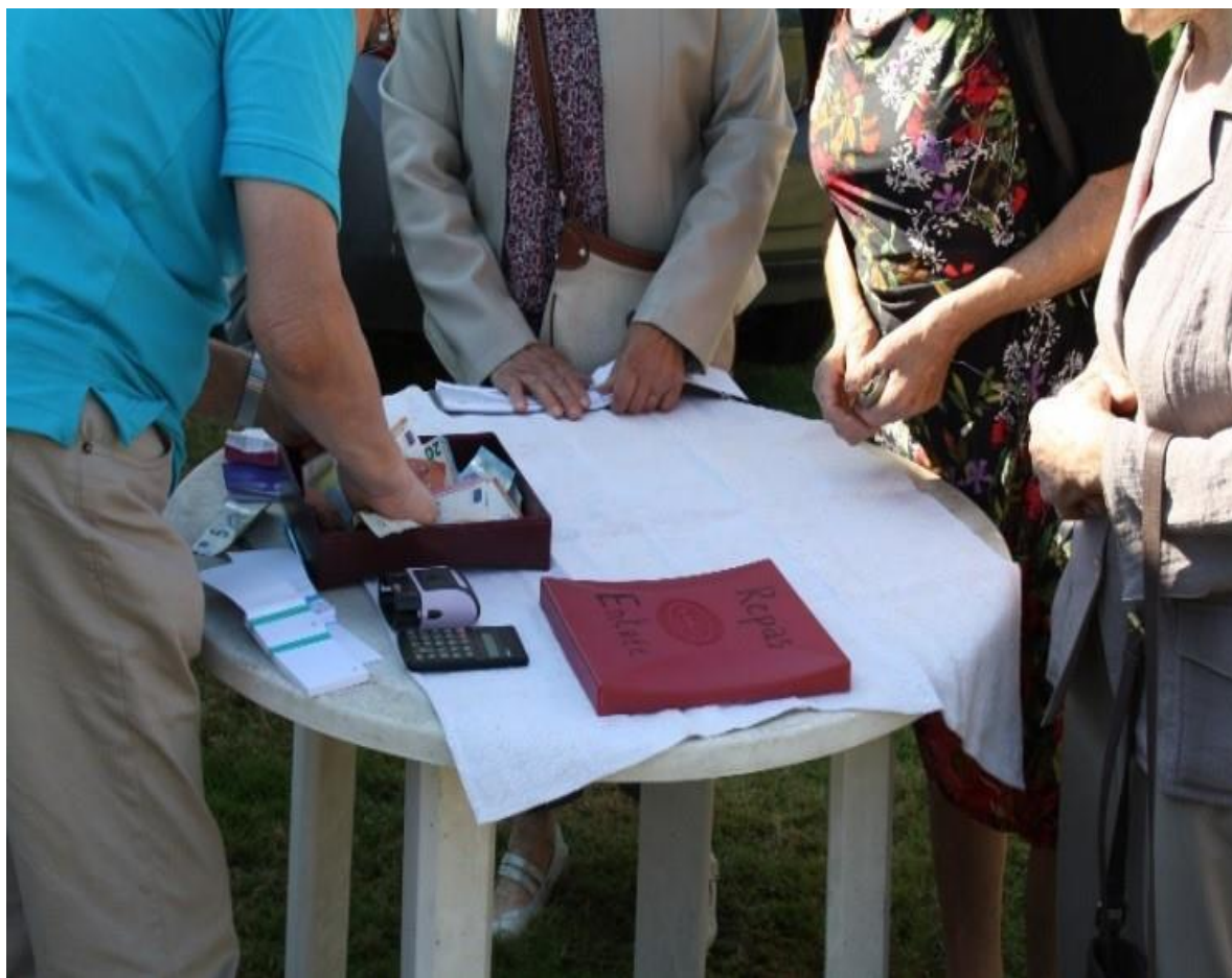
Ill. 10. Stand pour acheter son ticket repas, pardon de Locmaria à Langoëlan (Morbihan).