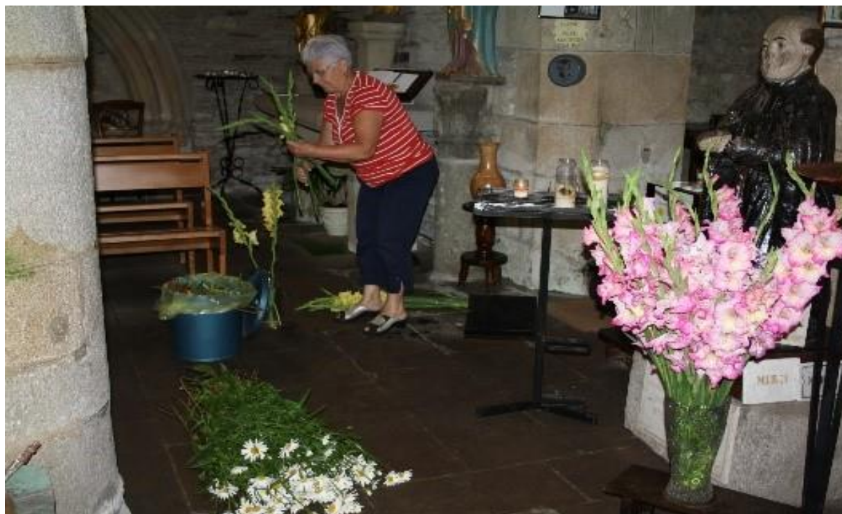
III. 1. Préparation des bouquets, pardon de Plévin (Côtes d'Armor), 13 juillet 2017.

Toute la chapelle est fleurie de bouquets réalisés par les bénévoles [ill. 1]. Rares sont ceux qui achètent les fleurs chez un fleuriste ; la plupart du temps, les bouquets sont réalisés par des femmes avec les fleurs provenant des jardins des bénévoles ou des habitants du quartier.