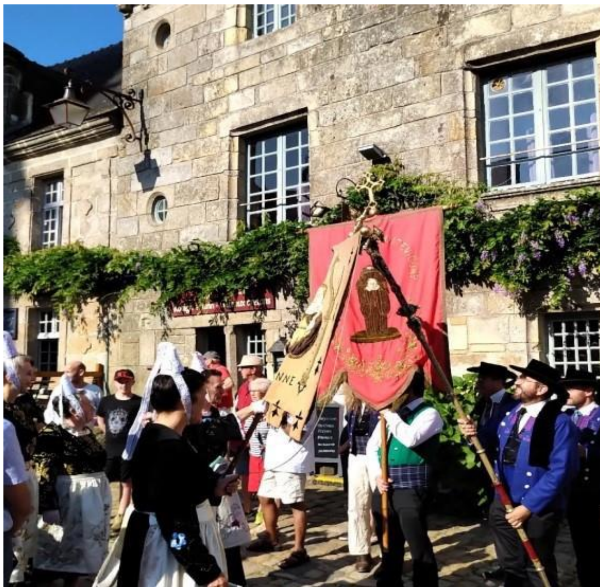
III. 5. Le baiser des bannières à la troménie de Locronan, 14 juillet 2019.

Avant la procession, les bannières voisines doivent se placer en ligne et sont saluées par la bannière du patron de la chapelle, suivant le rite dit du « salut des bannières ». Lors de certains grands pardons de sanctuaires ou lors de fêtes particulières, deux processions peuvent aussi se croiser et les deux paroisses, se saluer en inclinant leurs bannières respectives [ill. 5].