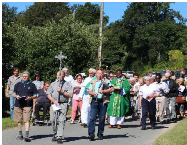
Procession du pardon de Saint Houarno à Langoëlan (Morbihan), 15 juillet 2018.