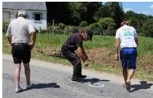
III. 12b. Concours de palets sur route, pardon de Saint-Houarno à Langoëlan (Morbihan).