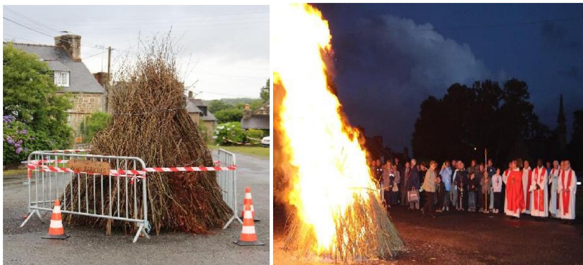
III. 7a-b. Tantad du pardon des Sept Saints au Vieux-Marché (Côtes d'Armor), 22 juillet 2017.

soi. Avant de mettre le feu, le tantad est béni par le célébrant avec l'eau de la fontaine.