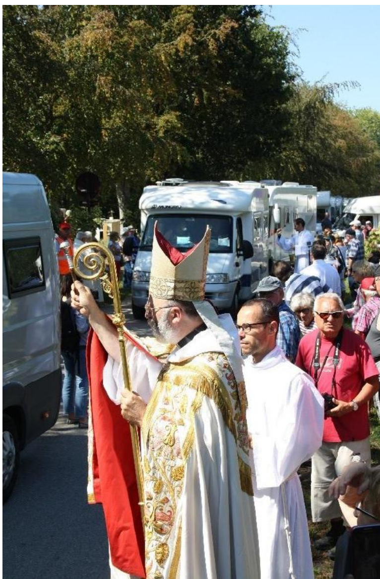
Ill. 20. Pardon des camping-caristes à Malestroit (Morbihan), 1 er septembre 2018.

Les pardons se recréent ainsi en permanence. À ce titre, on peut évoquer le pardon des motards à Porcaro (Morbihan) qui fêtait ses 40 ans en 2019 ou encore le pardon de Notre-Dame de Tronoën à Saint-Jean-Trolimon (Finistère), rebaptisé depuis 2012 le pardon des surfeurs, redynamisant ainsi l'événement en attirant de nouveaux participants. Il y a également le pardon des camping-caristes [ill. 20], dont la première édition a eu lieu en 2017 à Malestroit (Morbihan) et qui, en 2019, a vu plus de 300 camping-cars défiler durant la procession. Si Saint-Gilles, saint patron de Malestroit depuis le XV e siècle, était invoqué pour guérir de la peur, il est, depuis 2017, devenu le saint patron des camping-caristes. À l'initiative du curé de la paroisse, le père Yves Carteau, cette création contemporaine a pour objectif de redynamiser la fête de la Saint-Gilles en y associant les camping-caristes, de plus en plus nombreux dans une commune qui dispose de nombreux espaces leur étant dédiés.