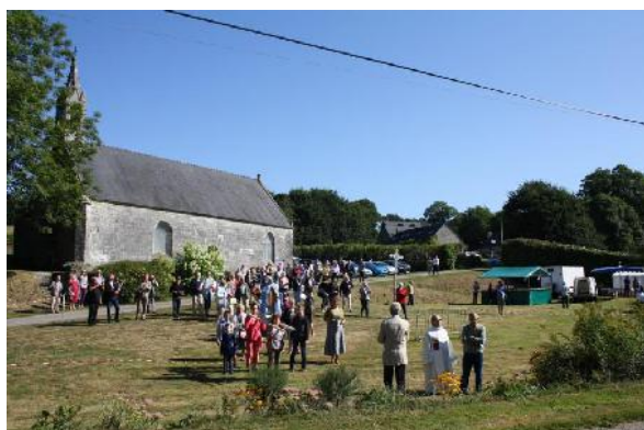
Site du pardon de Locmaria à Langoëlan (Morbihan), 2 septembre 2018.