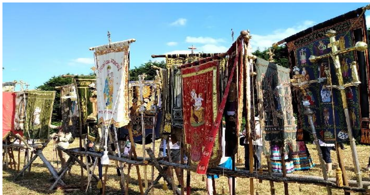
Ill. 18. Bannières portées lors de la troménie de Locronan (Finistère), 14 juillet 2019.

La Bretagne est la région française qui conserve le plus de bannières, difficilement dénombrables : le Finistère à lui seul en conserve plus de 4 000. Sur ce corpus, 62 datent de l'Ancien Régime, toutes classées (cf. base Palissy du ministère de la Culture) : soit 40 % des bannières françaises anciennes : rien d'étonnant dans une région aux nombreuses processions toujours actives. L'objet est en effet intimement lié aux pardons, il en représente l'objet iconique par excellence [Ill. 18]. Les deux faces textiles mesurent généralement 1,20 x 1,60 m, constituées de figures brodées ; le tout pèse souvent plus de 15 kg.