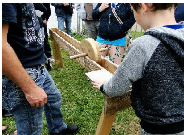
III. 12c. Jeu d'adresse en bois, pardon de Coat Keo à Scrignac (Finistère).