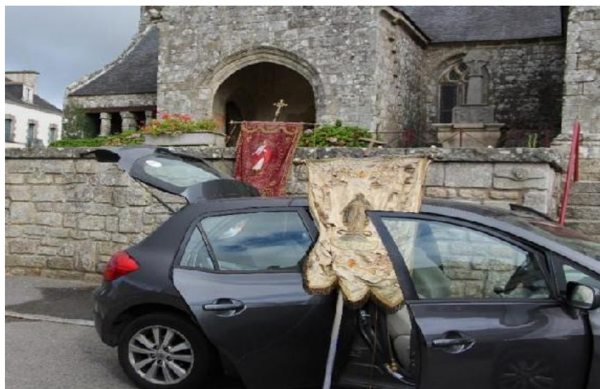
Ill. 2. Stockées dans l'église, les bannières sont emmenées à la chapelle pour le jour du pardon. © Julie Léonard, 2017.

Le plus souvent, il faut aller chercher les bannières et autres objets processionnels [ill. 2], pas toujours stockés dans la chapelle mais dans l'église paroissiale.