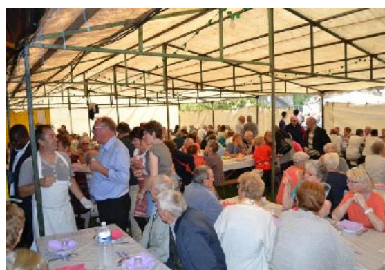
Repas du pardon de Longueville à Locmalo (Morbihan), 21 septembre 2014.