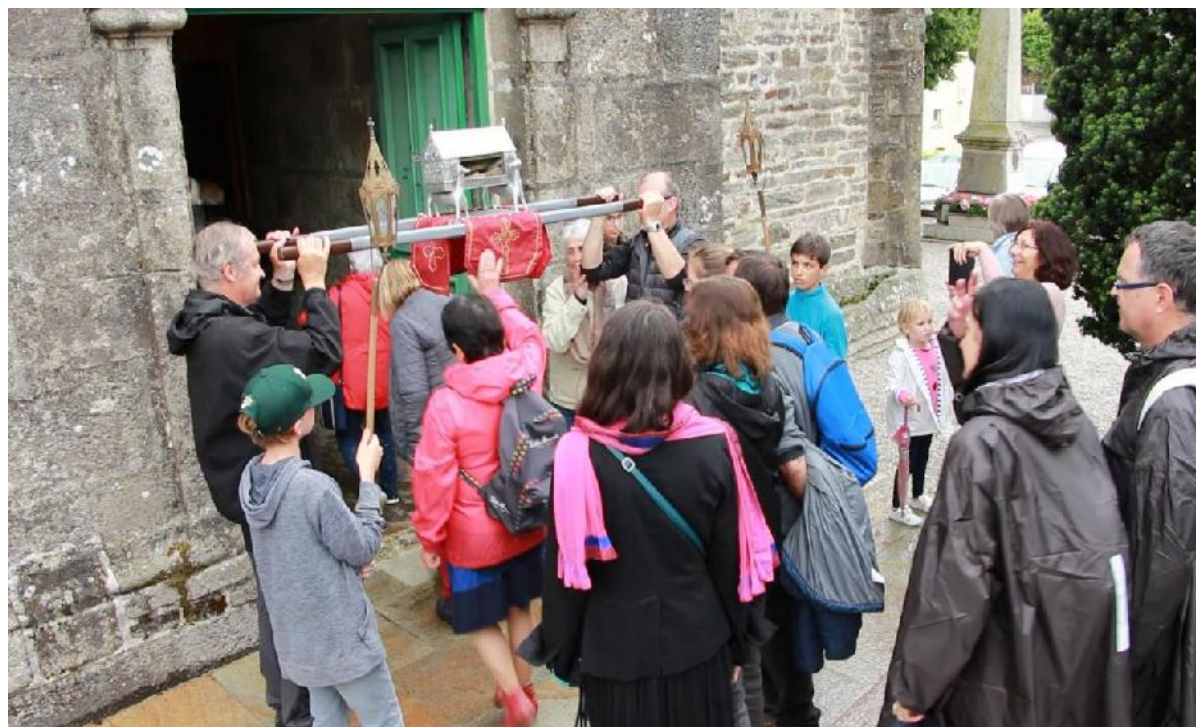
III. 4. Passage des pardonneurs sous les reliques lors de la troménie de Landeleau, 09 juin 2019.

Les processions ont un itinéraire de circumambulation pour certains pardons, mais la majorité vont de la chapelle ou de l'église à la fontaine. Les processions doivent se faire dans le sens dextrogyre, c'est-à-dire dans le sens des aiguilles d'une montre. Elles parcourent au minimum un tour et normalement trois tours, en sortant habituellement par le porche ouest de l'édifice. Avant le retour dans le sanctuaire, les pardonneurs sont invités à passer sous les reliques, dans un rituel de protection [ill. 4].