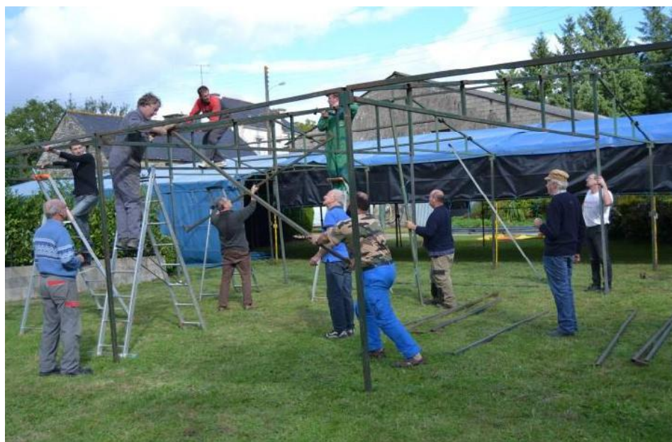
Ill. 3. Installation des chapiteaux pour le repas du pardon de Longueville à Locmalo ( Morbihan ), 20 septembre 2015.

Quand un fest-deiz, un fest-noz ou des concerts sont proposés, il faut également installer la scène et le parquet pour les danseurs.