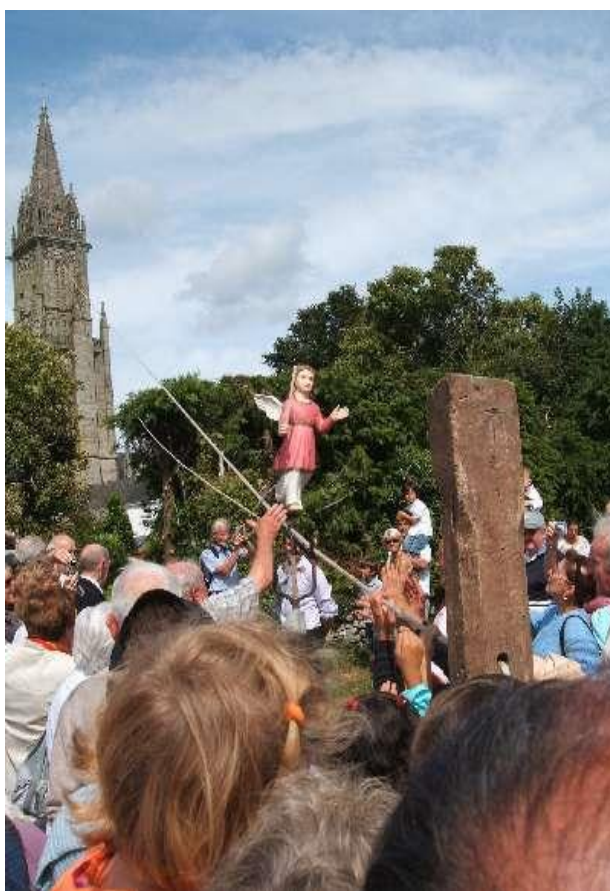
III. 8. Descente de l'ange pyrophore au pardon de la chapelle de Quelven (Morbihan)

Le feu de joie peut également être allumé avec un ange pyrophore (le feu du ciel descend alors littéralement sur terre). C'est encore le cas notamment au pardon de Quelven à Guern (Morbihan) [III. 8] , au pardon de Sainte-Noyale à Noyal-Pontivy (Morbihan), au pardon de Cléguérec (Morbihan), au pardon de Crénénan à Ploërdut (Morbihan) ou encore au pardon de l'Isle à Gouelin (Côtes d'Armor). Le tantad peut également être allumé avec une colombe comme au pardon de Locjean à Riantec (Morbihan).