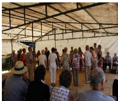
Ill. 11a-b. Fest-deiz au pardon de Locmaria à Langoëlan (Morbihan), 2 septembre 2018.

Différents types d'animations peuvent être organisées en plus des pratiques festives et rituelles évoquées : manifestations sportives ou ludiques (boules, quilles, palets, pétanque, cyclisme...) [ill. 12] , manifestations culturelles (concerts, défilés de cercles celtiques, défilés de tracteurs, danses, visites, expositions...), fest-deiz ou fest-noz, kermesses, loteries ou tombolas, marchands ambulants, fêtes foraines, manèges, brocantes ou encore feux d'artifice.