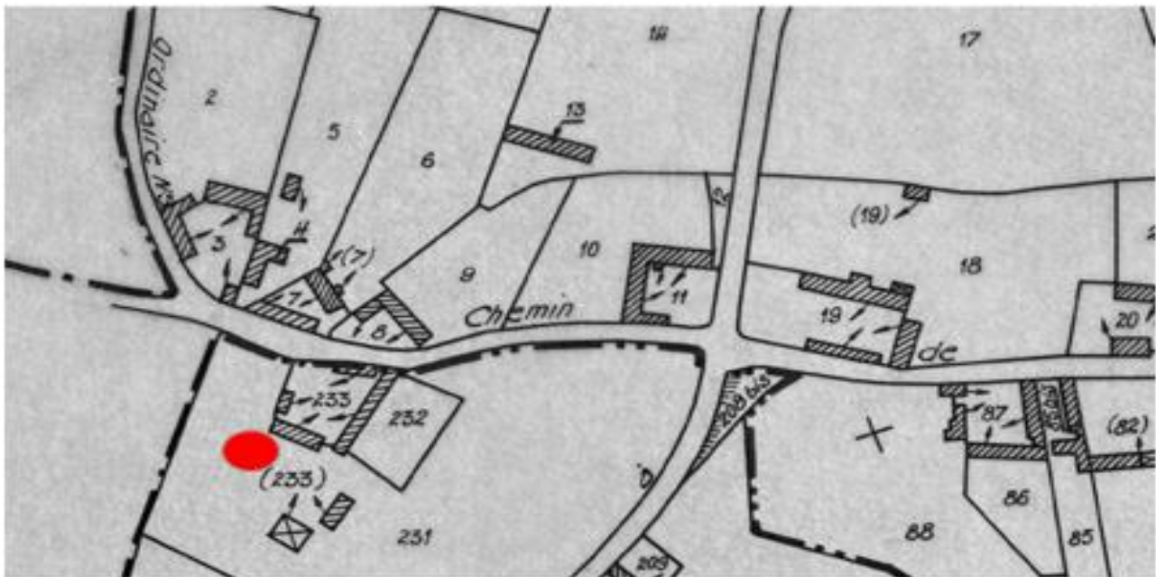
Maison n° 30 - Parcelle cadastre n° 233