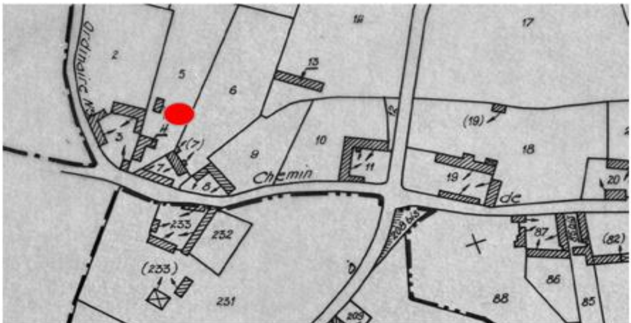
Maison n° 31 - Parcelle cadastre n° 4