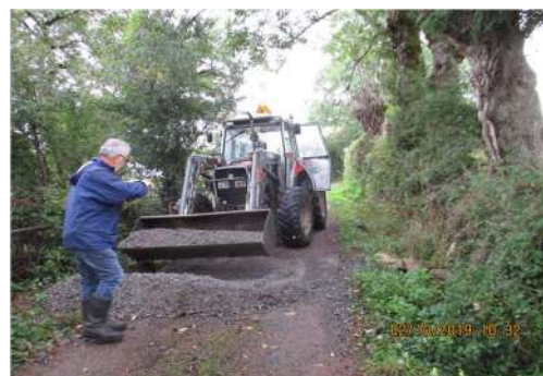
Divers travaux de voirie d'appoint