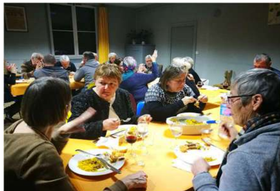
Repas des bénévoles suite à l'AG

En février 2019 remerciements des bénévoles