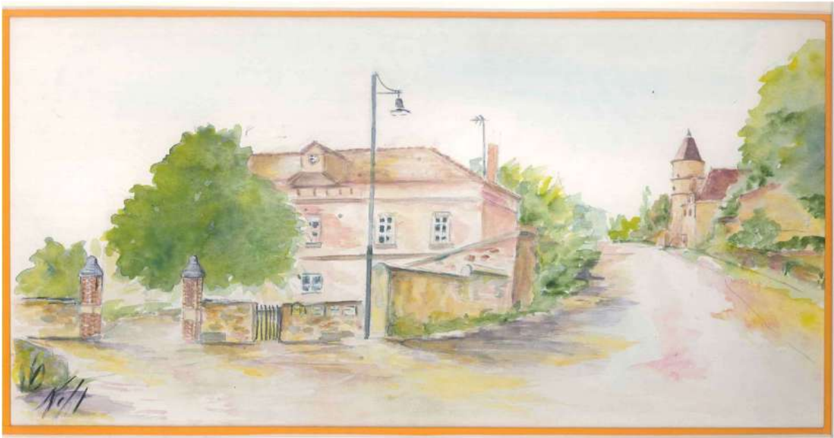
Aquarelle Denise KEHL 2015