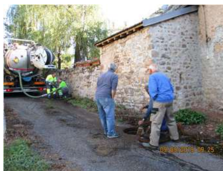
Prestation de travaux mutualisée à part égale entre propriétaire et commune

Sur 67 résidences habitées ( principales et secondaires ) de la commune 47 sont raccordées au réseau d'assainissement collectif communal soit 70 % des habitations représentant un potentiel de 88 habitants ( dont résidents secondaires ) qui bénéficient d'un retraitement collectif des eaux.