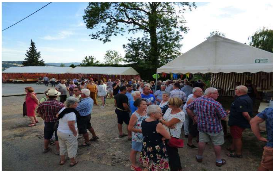
4 août 2019 : célèbre fête de l'entrecôte charolaise (280 repas servis) Pour 2020 réservez la date du 2 août