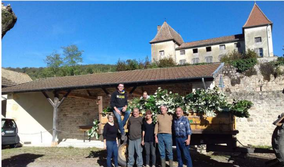
26 octobre 2019 : prestation citoyenne cimetière et cour de la mairie Deux fois plus d'administrés que d'élus ! À renouveler.