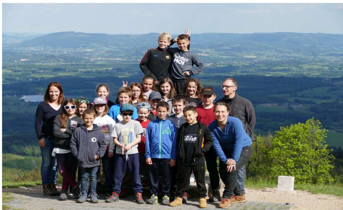
CE2-CM1-CM2 avec accompagnateurs Mont Beuvray mai 2019