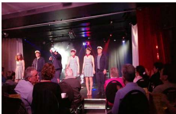
Sortie au cabaret Chapeau claqué à Gueugnon

Quelques éléments marquants d'une intense activité communale