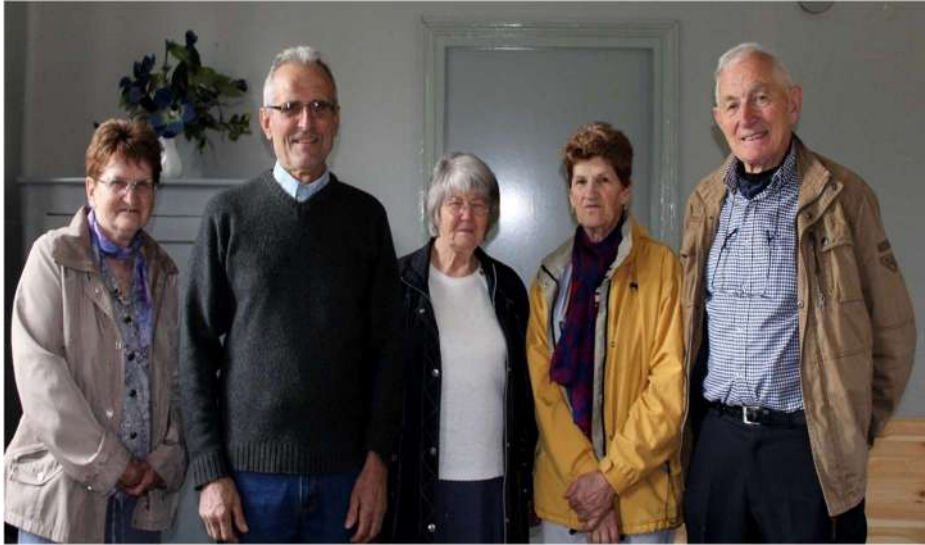
Un demi-siècle sépare ces élèves curtijots les reconnaissez-vous ?