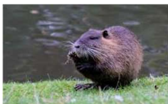
Le ragondin est un nuisible qui peut être chassé toute l'année. En 2019 ce sont 17 ragondins qui ont été capturés à la lagune d'assainissement collectif.

Merci aux membres de l'association et aux bénévoles pour toutes ces réussites