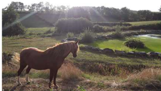
Lagune d'assainissement collectif