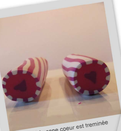
Voilà la cane coeur est terminée