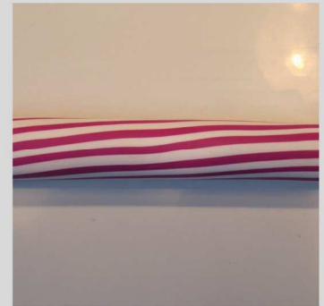
7. Une fois réduite, vous obtenez un long boudin