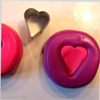
4. A l'aide d'un emporte pièce prélevez les coeurs dans chaque rouleaux et inversez leurs emplacements