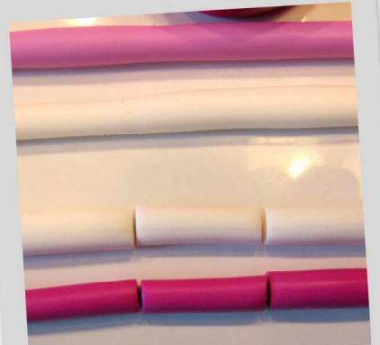
3. Coupez ces boudins en 5 segments identiques de la hauteur de vos rouleaux