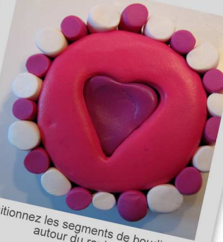
5. Positionnez les segments de boudins tout autour du rouleau