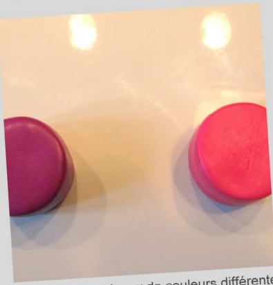
1. Réalisez 2 rouleaux de couleurs différentes