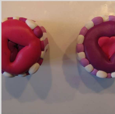
6. Réduire ses canes